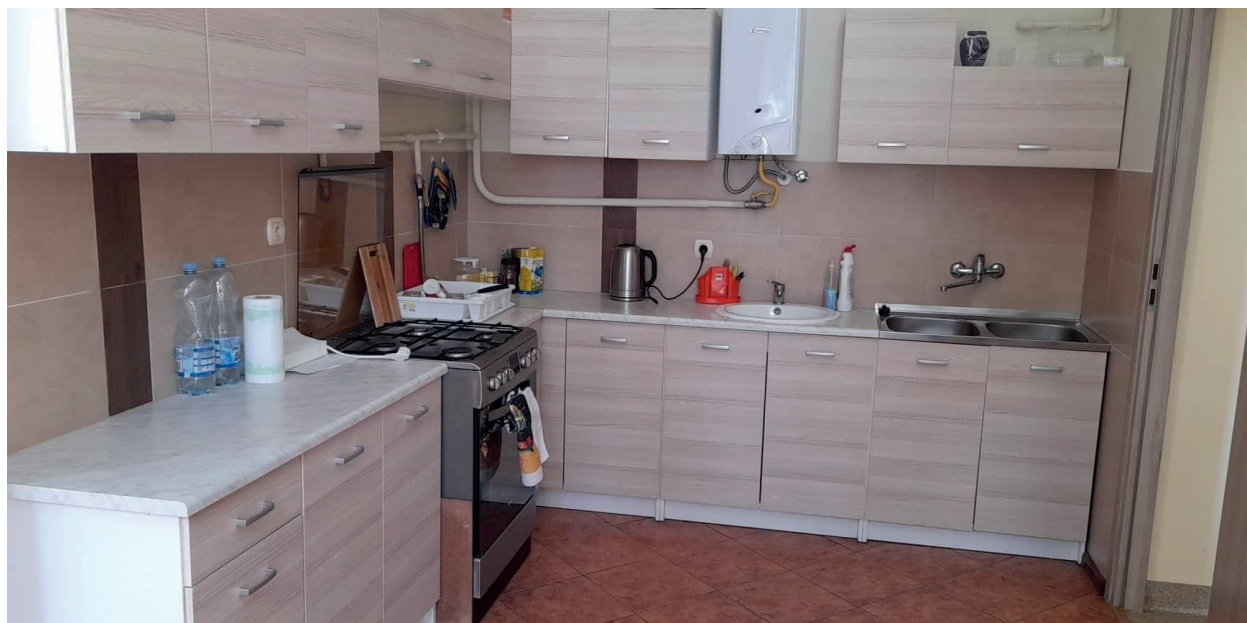
W Klubie Senior+ w Hubenicach wyposażono kuchnię