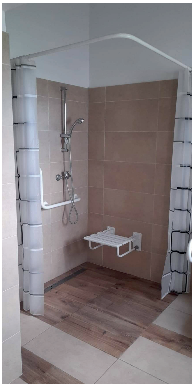
W Klubie Senior+ w Hubenicach przygotowano prysznic