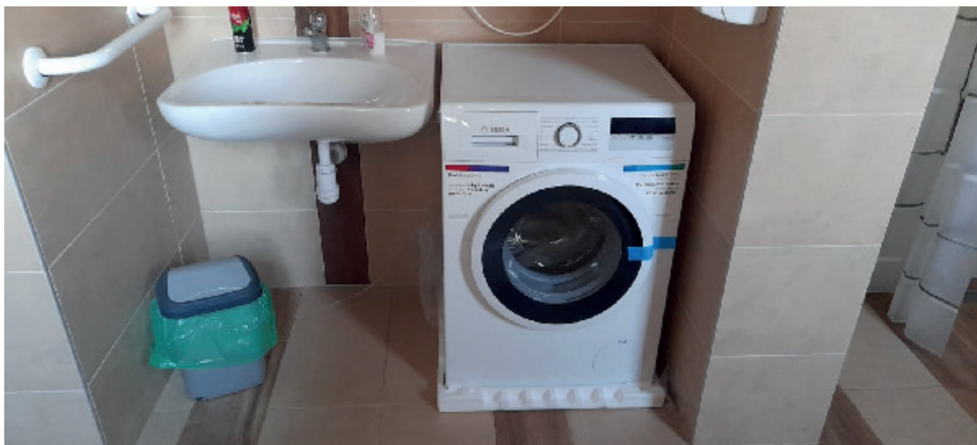
W Klubie Senior+ w Hubenicach zakupiono pralkę