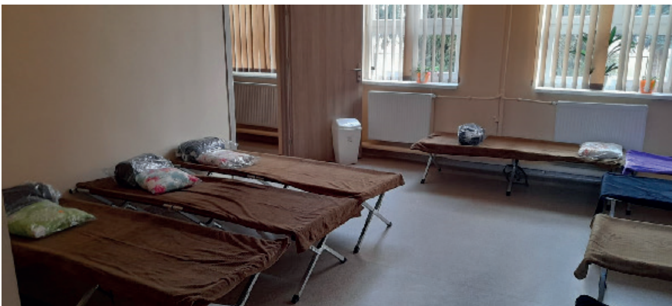
W Klubie Senior+ w Hubenicach przygotowano 10 miejsc dla uchodźców