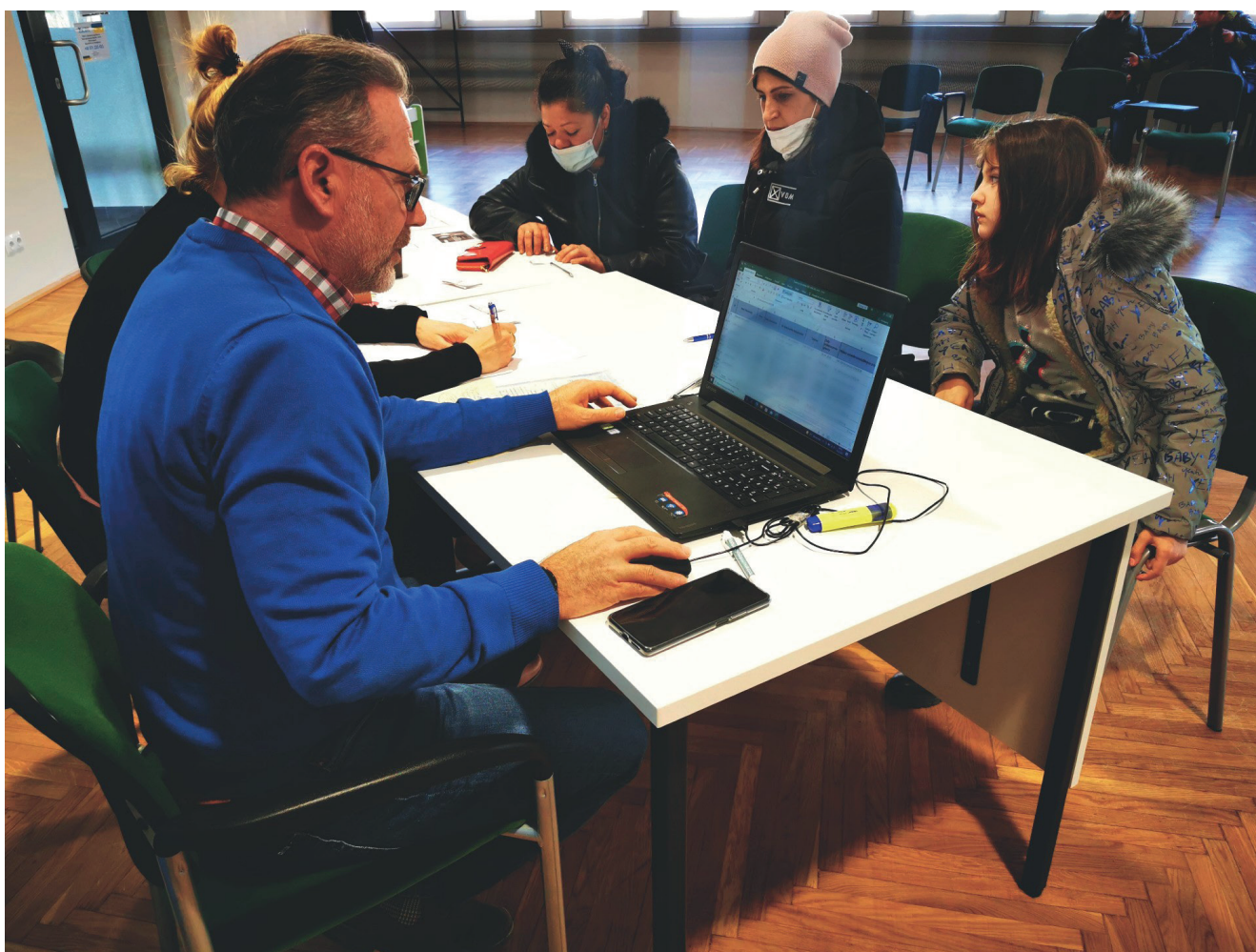
Rejestracja uchodźców w starostwie