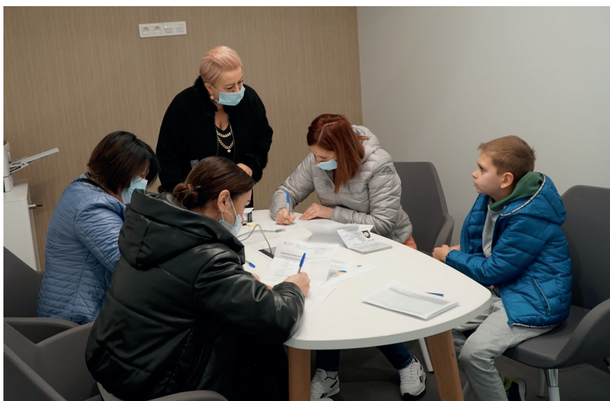
Pomoc pracowników starostwa przy wypełnianiu dokumentów bankowych