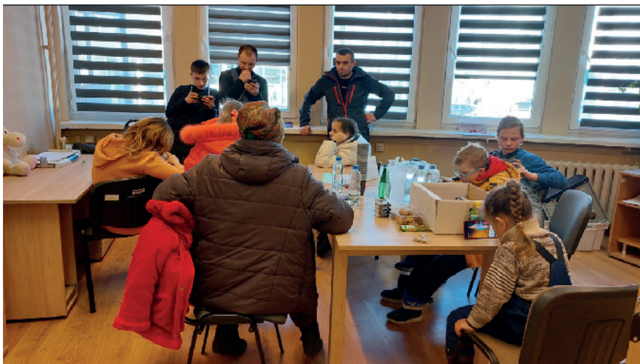
Udzielanie pomocy w pierwszym kontakcie