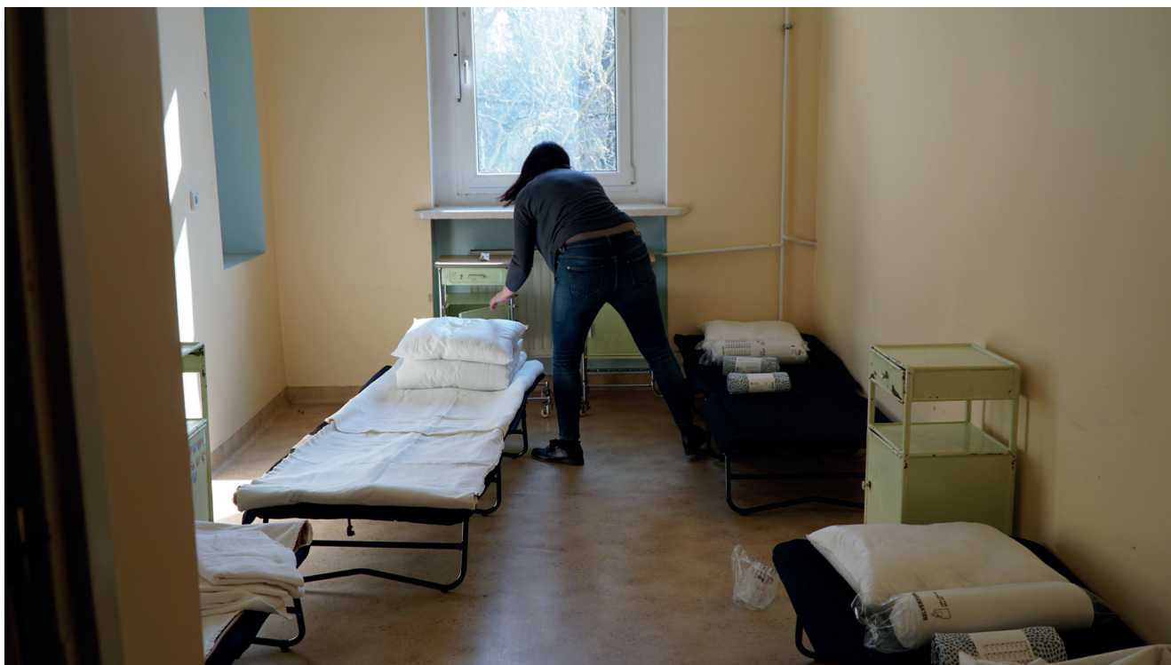
Przygotowanie miejsc noclegowych