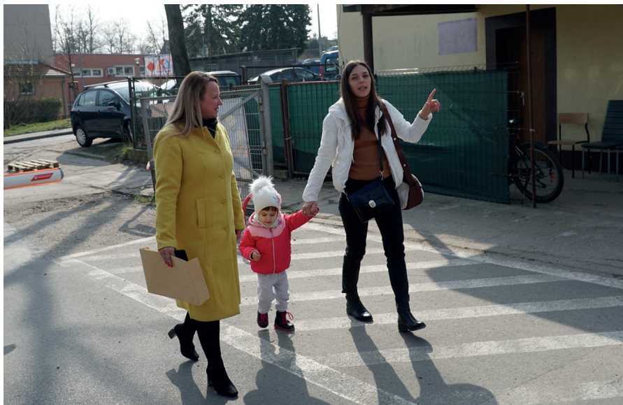
Pomoc pracowników starostwa w rejestracji do gabinetów specjalistycznych