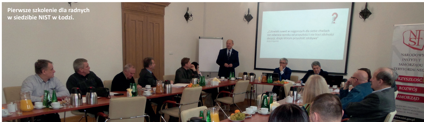
Pierwsze szkolenie dla radnych w siedzibie NIST w Łodzi.