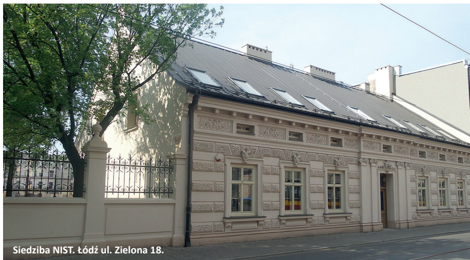
Siedziba NIST. Łódź ul. Zielona 18.

RACJONALNIE BUDOWAĆ SAMORZĄD ciąg dalszy ze str. 1