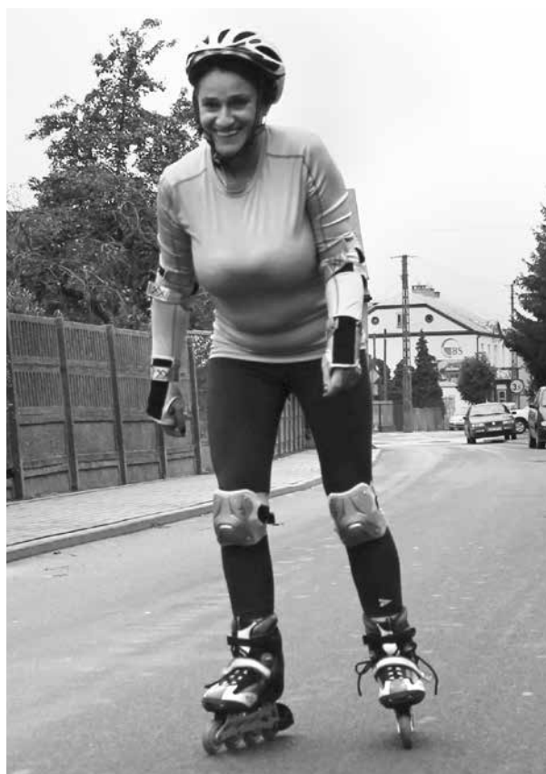
W wolnym czasie na rolkach

Gmina Uniejów ma to szczęście, że trafiły nam się gorące źródła, tryskające energią społeczeństwo z inicjatywą i wóldarz, który świetnie potrafił to wykorzystać i odpowiednio te właściwości ukierunkować.