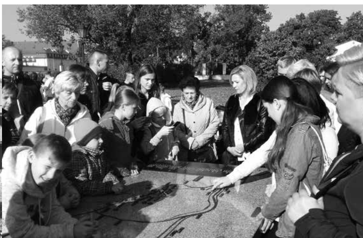
arch. P. Kozłowski