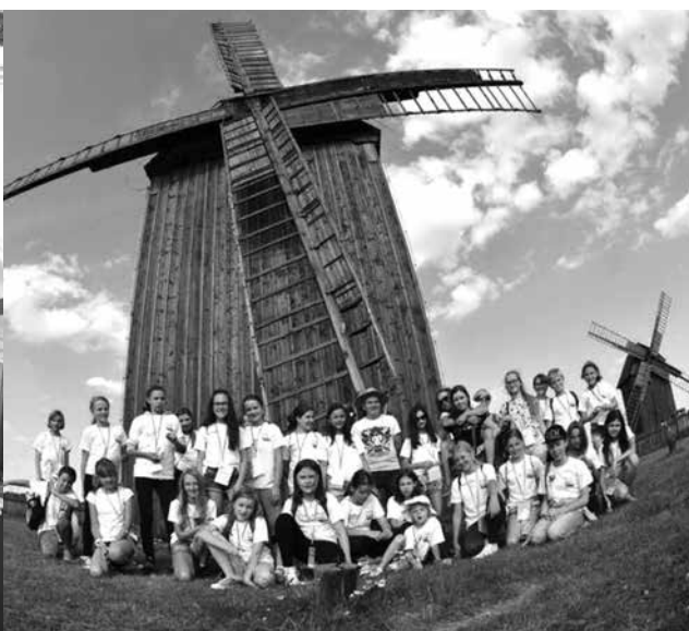
arch. UM Uniejów