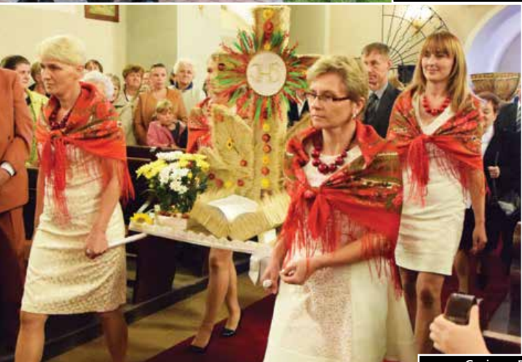
Gminne Dożynki w Wieleninie