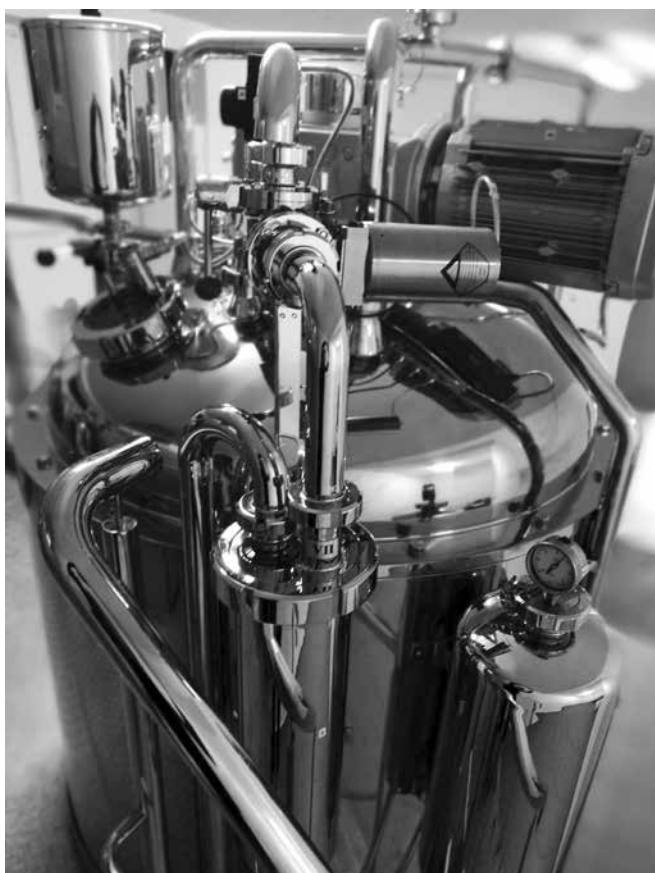
arch. Firma OVER Group

Firma OVER Group, aby wyjść na przeciw oczekiwaniom Klientów, wprowadza kolejne zmiany. W sierpniu uruchomiona została nowa „Linia Procesowa 1049 - 1052”. Urządzenie przeznaczone jest do wytwarzania produktów kosmetycznych oraz preparatów pielęgnacyjnych dla zwierząt. Rozwiązania techniczne zastosowane w urządzeniu umożliwiają prowadzenie procesu w pełni kontrolowanych warunkach grzania i chłodzenia oraz przebieg procesu pod ciśnieniem poniżej atmosferycznego (podciśnienie). Pojemność robocza głównego zbiornika wynosi: 600 litrów, natomiast zapotrzebowanie całej linii procesowej ma moc elektryczną: 162,5 kW. Na takich urządzeniach produkowane są także kosmetyki serii Termy Uniejów.