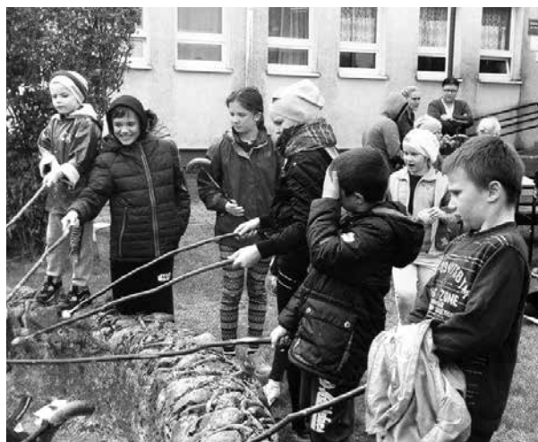
arch. SP Wilamów

Akcja została poprzedzona pogadanką, która miała na celu przypomnienie zasad zbierania odpadów oraz zwrócenie uwagi na bezpieczeństwo w czasie sprzątania.