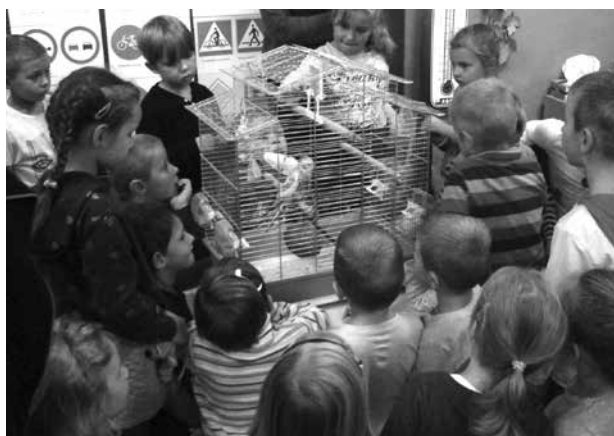
Papuga Neosia z wizytą u przedszkolaków

wszystkim o jego ulubionych przysmakach, zwyczajach oraz opiece. Dzieci chętnie, a zarazem delikatnie głaszały i obserwowały zachowanie króliczka.