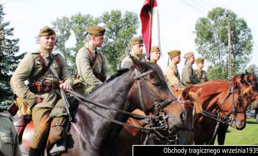
Obchody tragicznego września 1939 roku we wsi Czekaj