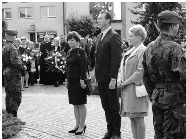
arch. R. Troczyński

Podwójny, symboliczny jej wymiar stanowił fakt, że miała ona miejsce w dniu rozpoczęcia roku szkolnego 2017/2018 – pierwszego roku wprowadzania reformy systemu edukacji w Polsce. Dyrektor uniejowskiej Szkoły, w krótkim wystąpieniu poinformowała, że Rada Miejska podjęła uchwałę, iż z mocy ustawy z dniem pierwszego września br. Zespół Szkół został przekształcony w ośmioletnią Szkołę Podstawową, która nadal będzie nosić imię Bohaterów Września 1939 r. W Szkole jeszcze przez dwa lata będą prowadzone oddziały gimnazjalne. Podkreśliła także, że to Imię, które zobowiązuje do szczególnej pamięci o przeszłości, będąc jednocześnie przestrogą, myślą o przyszłości bez wojen i nienawiści, w której uczniowie uniejowskiej Szkoły odnajdą się jako dobrzy, porządni i mądrzy ludzie: Polacy i Obywatele Świata.