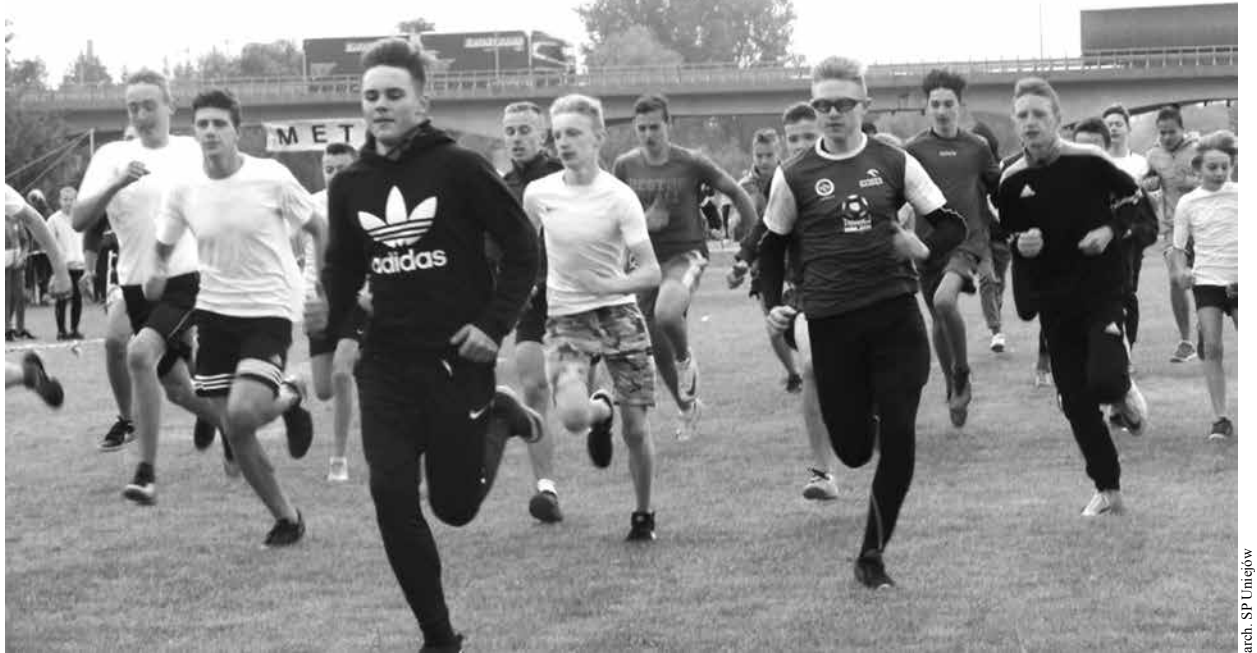
arch. SP Uniejów