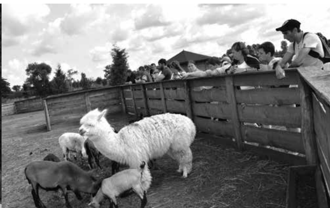
arch. PŚDS w Czepowie