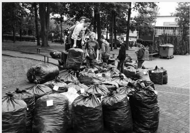
arch. E. Bartnik

Cieszymy się, że nakrętki zbierali nasi uczniowie, nauczyciele, a także całe rodziny, które pomaganie mają we krwi i czują potrzebę niesienia pomocy najbardziej potrzebującym. Przedsięwzięcie miało przede wszystkim wymiar charytatywny, ale także ekologiczny