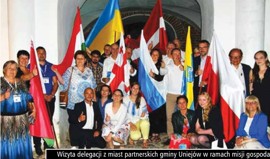
Wizyta delegacji z miast partnerskich gminy Uniejów w ramach misji gospodarczej