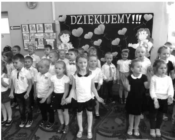
Dzień Edukacji Narodowej