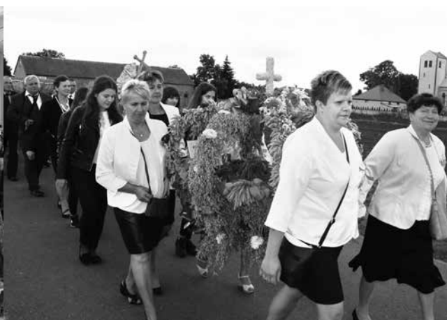
arch. R. Troczyński