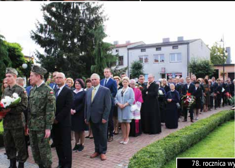
78. rocznica wybuchu II wojny światowej