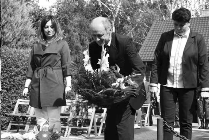
arch. R. Troczyński