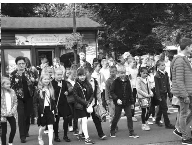
arch. UM Uniejów