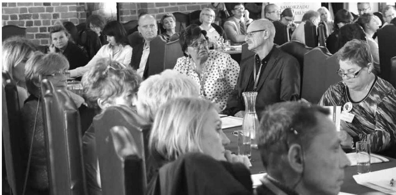
arch. UM Uniejów

Patronat honorowy nad konferencją objęli: Ministerstwo Zdrowia, Wojewoda Łódzki, Uniejów Uzdrawisko Termalne.