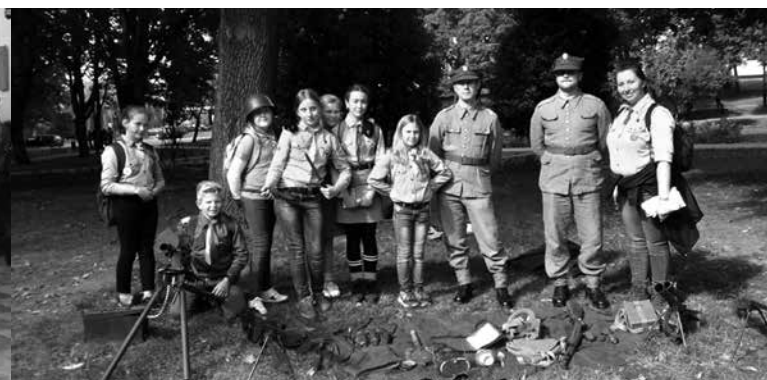
arch. Komenda Hufca ZHP Uniejów