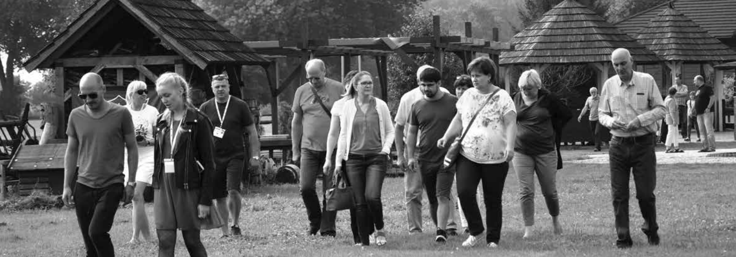
Przedstawiciele zagranicznych delegacji z wizytą w Gajewnikach