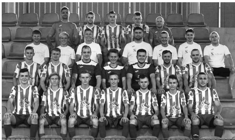
Skład rundy jesiennej sezonu 2017/2018:

Jeśli chcesz być na bieżąco zapraszamy na facebookowy fanpage naszej drużyny oraz na stronę www.mglks.pl. Zachęcamy również do dyskusji, gdzie pod basztą często można znaleźć ciekawe posty.