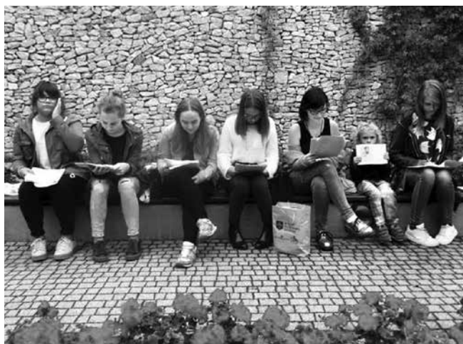
Młodzieżowa Rada Miejska w Uniejowie czyta „Wesele” S. Wyspiańskiego

Akcja Narodowe Czytanie organizowana jest przez Prezydenta RP od 2012 roku. Została zainicjowana wspólną lekturą „Pana Tadeusza” Adama Mickiewicza. W 2013 roku w całej Polsce odbyło się czytanie dzieł Aleksandra Fredry, podczas następnych edycji przeczytano: „Trylogię” Henryka Sienkiewicza oraz „Lalkę” Bolesława Prusa. W ubiegłym roku „Quo vadis” Henryka Sienkiewicza przeczytano w ponad 2200 miejscach.