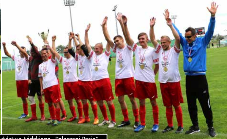
I Integracyjny Turniej Piłki Nożnej o Puchar Marszałka Województwa Łódzkiego „Połączeni Pasją”