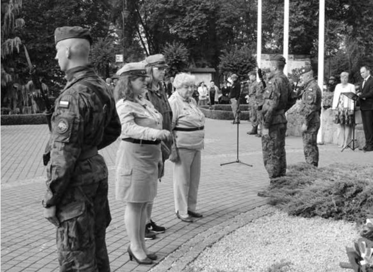
arch. R. Troczyński