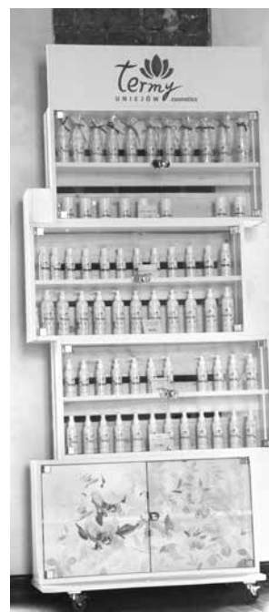
arch. UM Uniejów