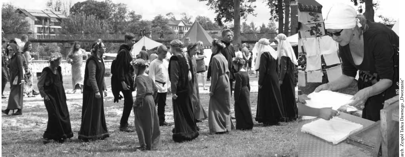
arch. Zespół Tańca Dawnego „Dworzanie”