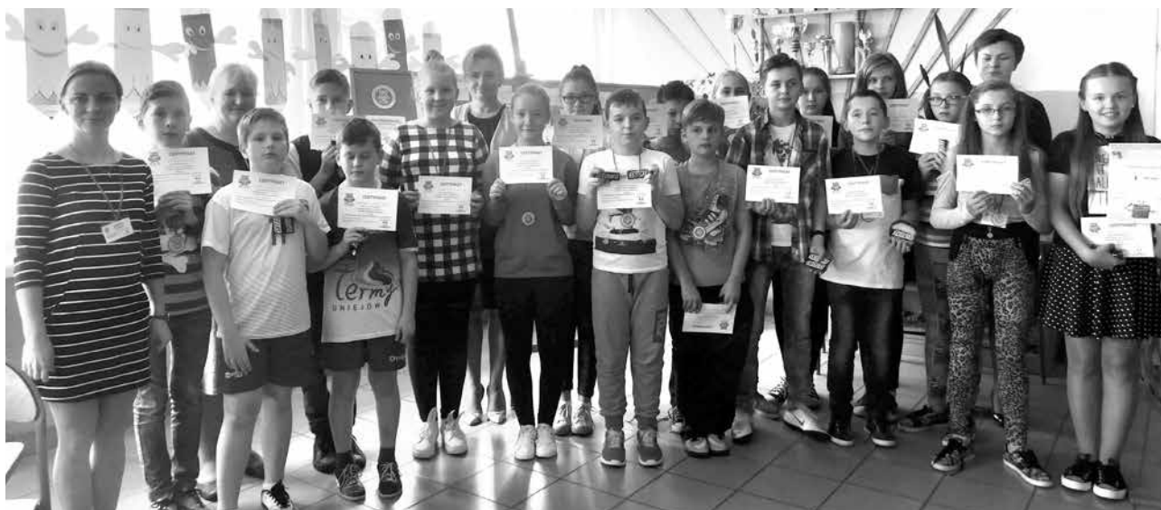
Eksperci Tabliczki Mnożenia z wychowawcami

W myśl hasła: „Nie ma śmieci - są surowce!” nasze SKO prowadzi całoroczną zbiórkę makulatury. W kampanię „Sprzątanie świata – Polska”, promującą nieśmiecenie, segregację odpadów i inne proste sposoby, jak na co dzień chronić środowisko angażujemy