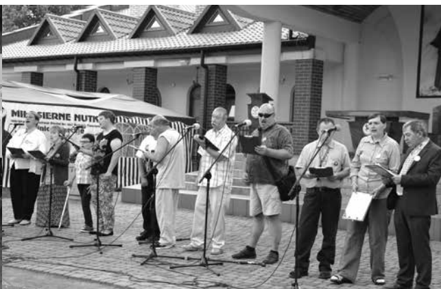
arch. PŚDS w Czepowie