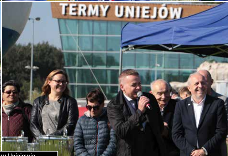
Wojewódzka Inauguracja Sportowego Roku Szkolnego w Uniejowie