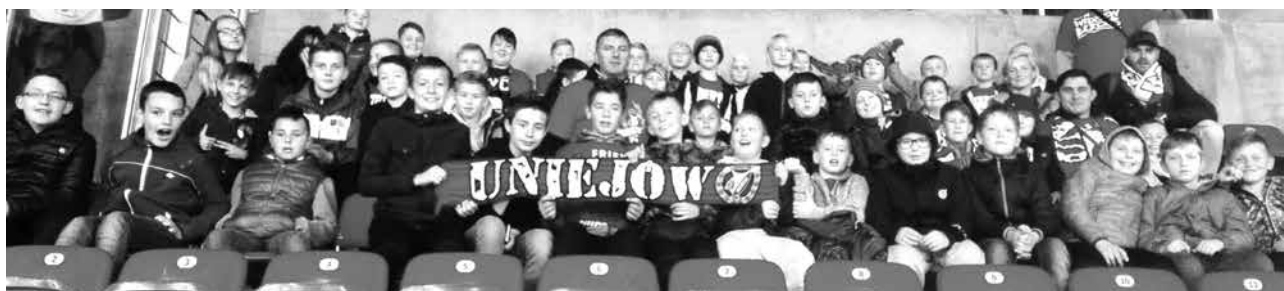
arch. Uniejowskie Stowarzyszenie „Aktywni”