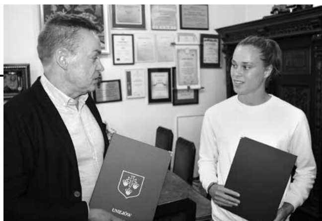
arch. R. Troczyński