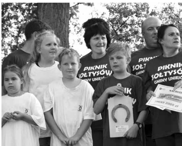
I miejsce drużyny z Wielenina na Pikniku Sołtysów w Ostrowsku w 2017 roku

skonstruowany ten „wulkan energii”. Ma status rodziny zastępczej i tak: od 2011 r. przez cztery lata wzięła pod swoje skrzydła 15-latkę; w 2017 r. na okres wakacji zaopiekowała się 9-letnim chłopcem i 12-letnią dziewczynką. W Szkole Podstawowej w Wieleninie Pani Sołtys jest w Radzie Rodziców przewodniczącą od trzech lat i wspólnie z rodzicami organizuje różne projekty dla dzieci.