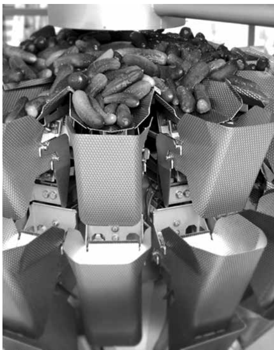
Produkcja Ogórka Termalnego w Firmie Bracia Urbanek

Tak, jest to pierwszy tego typu produkt dla nas i pierwszy tego typu produkt na rynku, możemy powiedzieć, że jest to dla nas wszystkich produkt pilotażowy, dzięki któremu chcemy sprawdzić na ile konsumenci będą zainteresowani tego typu produktami. Oczywiście mamy w zanadrzu kolejne ciekawe propozycje. Produkcję tych nowych wyrobów będziemy uruchamiać w przypadku dobrego przyjęcia obecnego produktu i oczywiście po zakończeniu prac badawczych prowadzonych przez Instytut Ogrodnictwa w Skierniewicach.