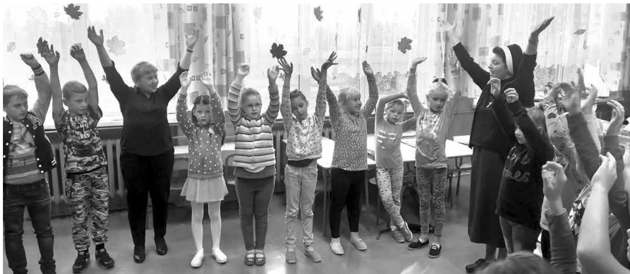
arch. SP Wilamów