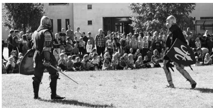
Pokaz walk rycerskich uniejowskich rycerzy dla uczniów tamtejszej szkoły