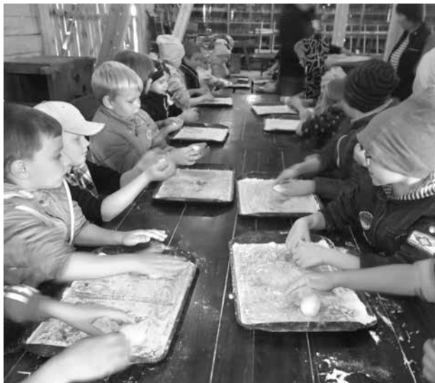
Zajęcia dzieci 6-letnich w Zagrodzie Młynarskiej