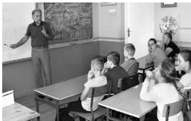
arch. UM Uniejów

Głównym celem prelekcji było przybliżenie uczniom zagadnienia odnawialnych źródeł energii, a w szczególności zapoznanie ich z największym bogactwem przyrodniczym naszego uzdrowiska.