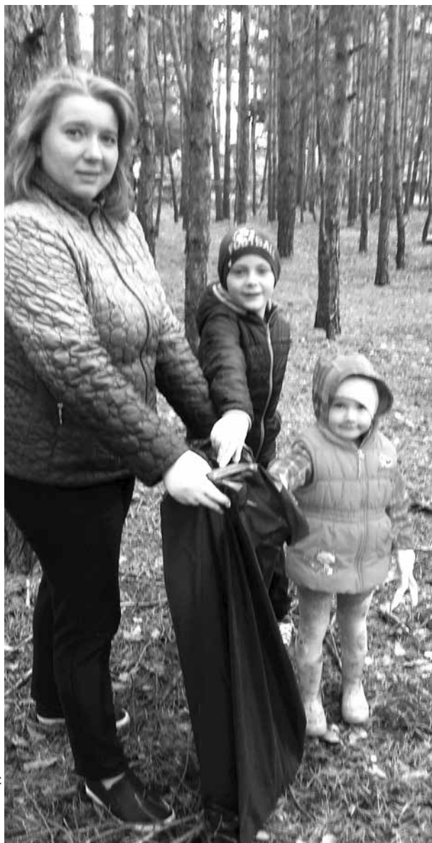
arch. PSP w Spycimierzu