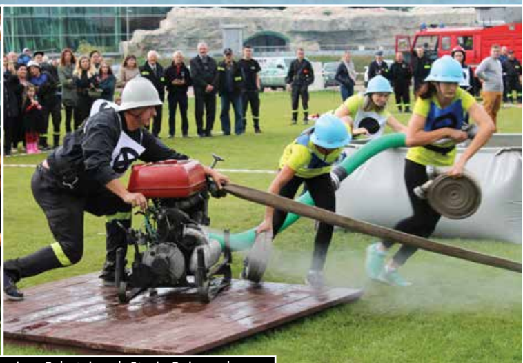
Powiatowe Zawody Sportowo-Pożarnicze Ochotniczych Straży Pożarnych