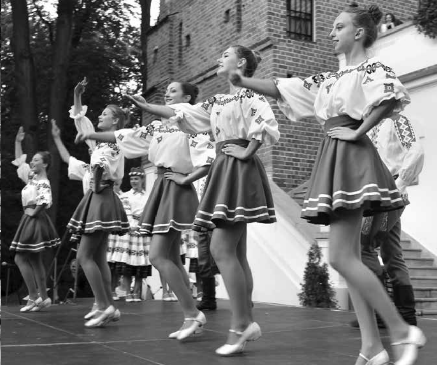
Występ Zespołu Tanecznego „Kryształiki” z Białorusi