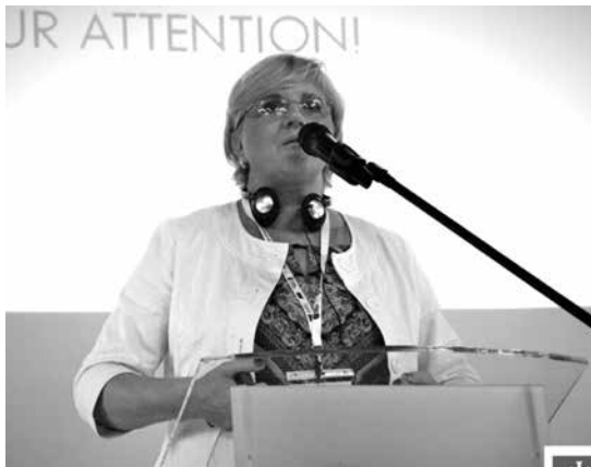
Przedstawiciele miast partnerskich na konferencji w uniejowskim zamku

Trzeci, niedzielny program misji był połączony z obchodami Dnia Ormiańskiego w naszym uzdrowisku.