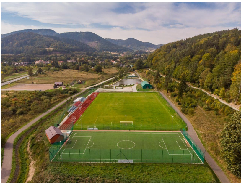
Kompleks Active Jedlina – Jedlina-Zdrój