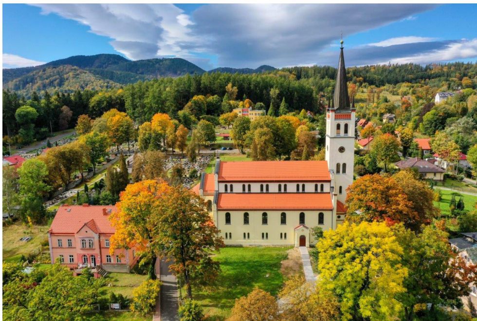
Kościół przy ul. Jana Pawła II z wieżą widokową w Jedlinie-Zdroju