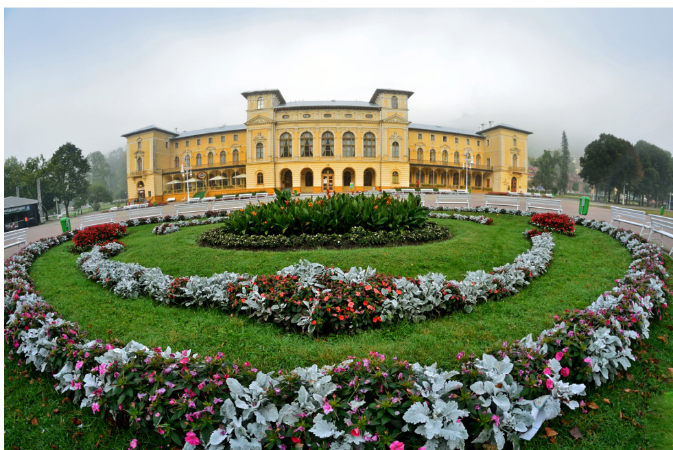
Stary Dom Zdrojowy w Krynicy-Zdroju