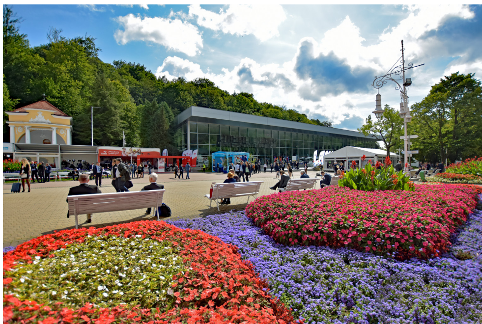
Deptak z Pijalnią Główną i Muszlą Koncertową w Krynicy-Zdroju