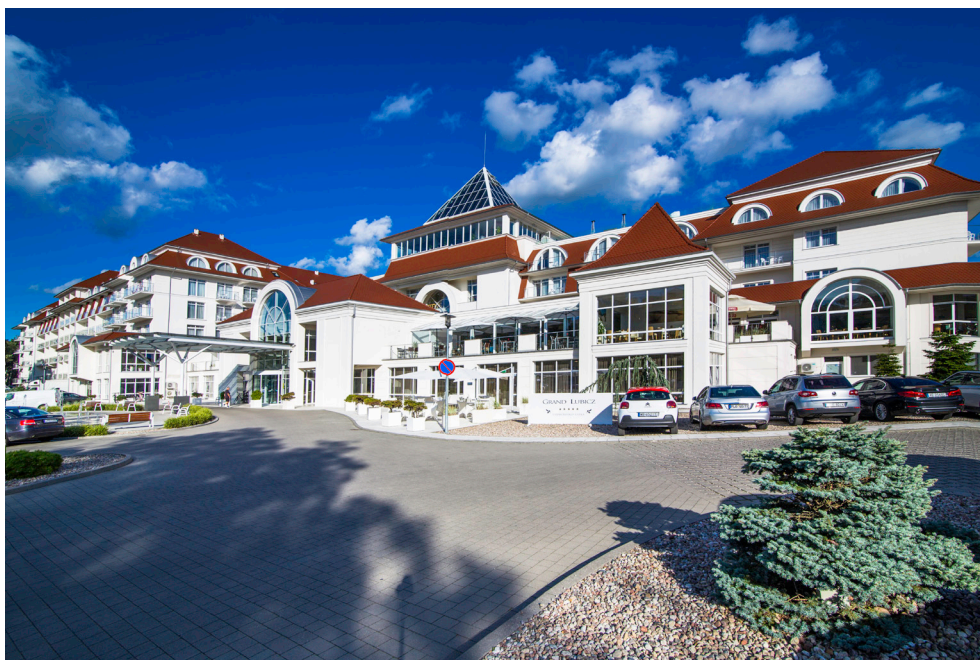
Hotel Grand Lubicz – Uzdrowisko Ustka