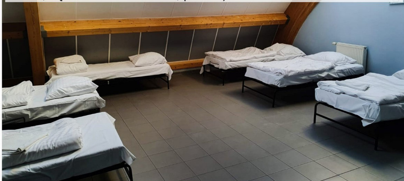
Miejsca pobytu przygotowane w obiekcie MOSiR - 5.03.2022 r.

Dzięki sprawnej organizacji żołnierzy z 8 Batalionu Remontowego w Kołobrzegu oraz MOSiR miejska Hala Łuczniczka stała się bezpiecznym miejscem pobytu czasowego dla uchodźców. 36 łóżek, kącik zabaw dla dzieci, przewijak dla maluszków.