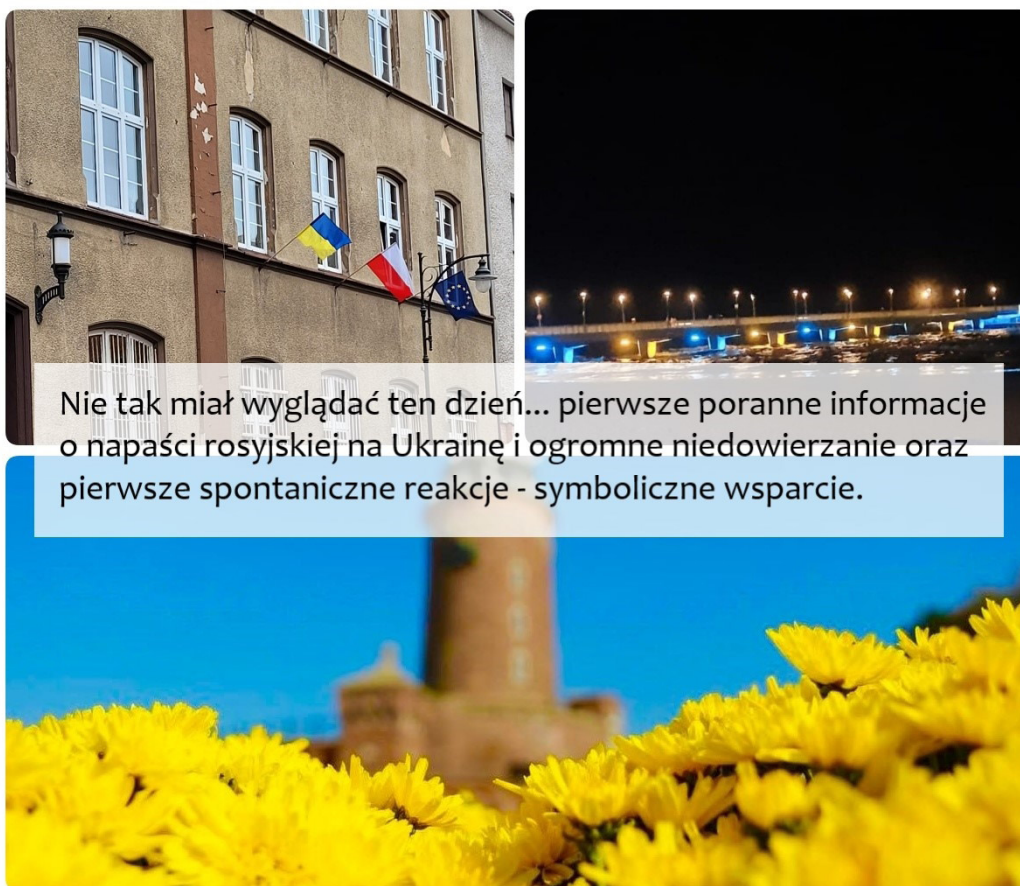
Początek agresji rosyjskiej w Ukrainie - 24.02.2022 r.