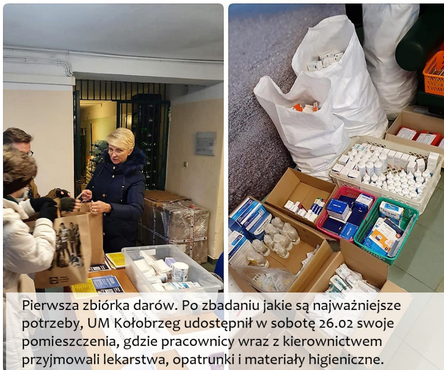
Pierwsza zbiórka darów. Po zbadaniu jakie są najważniejsze potrzeby, UM Kołobrzeg udostępnił w sobotę 26.02 swoje pomieszczenia, gdzie pracownicy wraz z kierownictwem przyjmowali lekarstwa, opatrunki i materiały higieniczne.

Pierwsza zbiórka darów dla ofiar wojny - 26.02.2022 r.