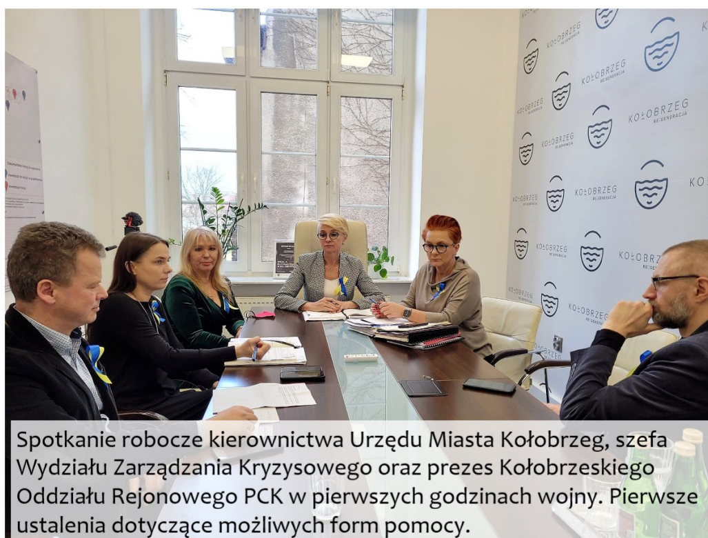
Spotkanie robocze - pierwsze ustalenia dotyczące możliwości pomocy - 25.02.2022 r.