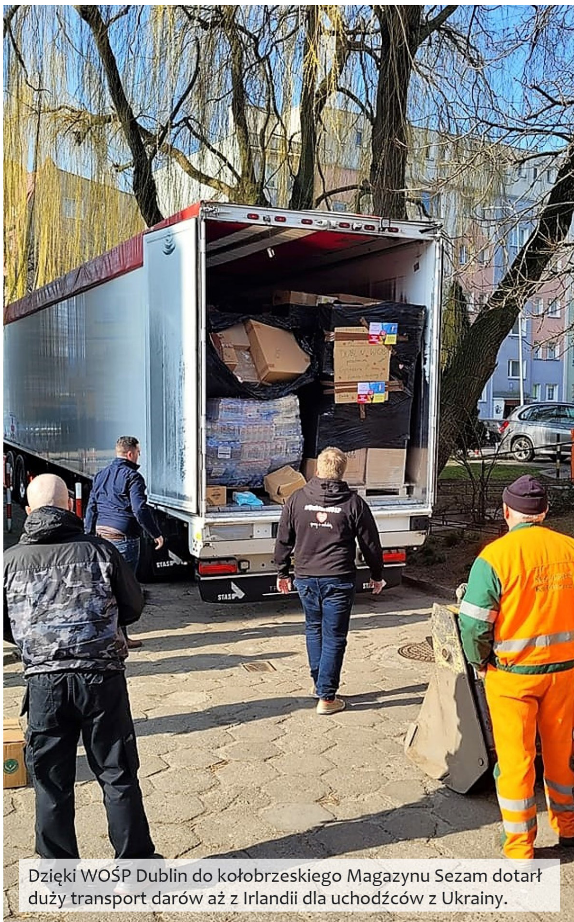
Dzięki WOŚP Dublin do kołobrzeskiego Magazynu Sezam dotarł duży transport darów aż z Irlandii dla uchodźców z Ukrainy.

Transport darów z Irlandii do Magazynu Sezam - 25.03.2022 r.