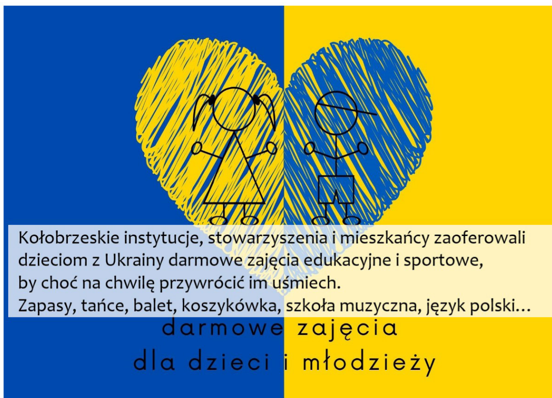
Darmowe zajęcia dla dzieci i młodzieży z Ukrainy - 3.03.2022 r.