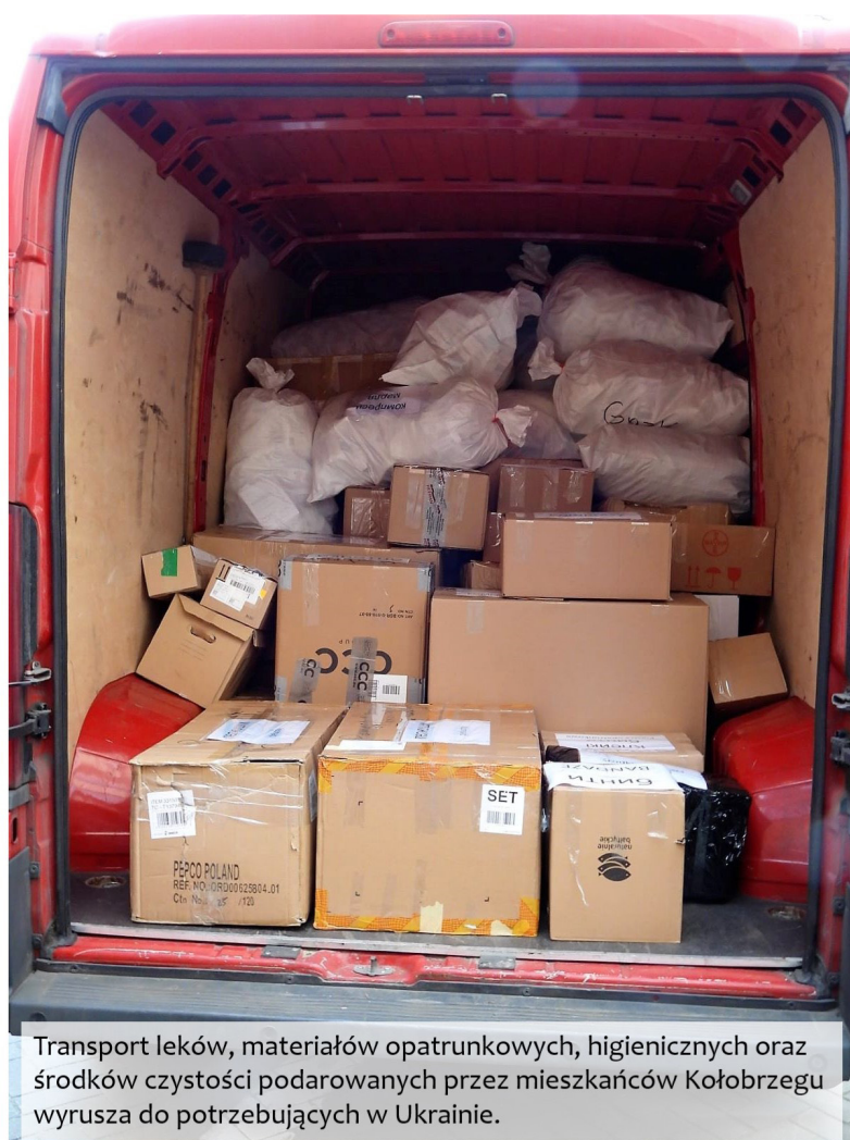
Transport leków, materiałów opatrunkowych, higienicznych oraz środków czystości podarowanych przez mieszkańców Kołobrzegu wyrusza do potrzebujących w Ukrainie.

Pierwsza zbiórka darów dla ofiar wojny - 26.02.2022 r.