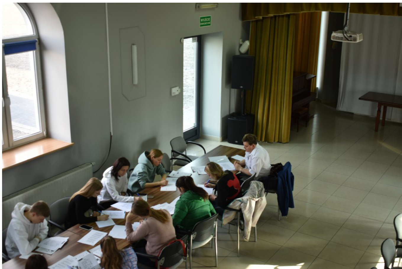
Nauka języka polskiego dla uchodźców z Ukrainy