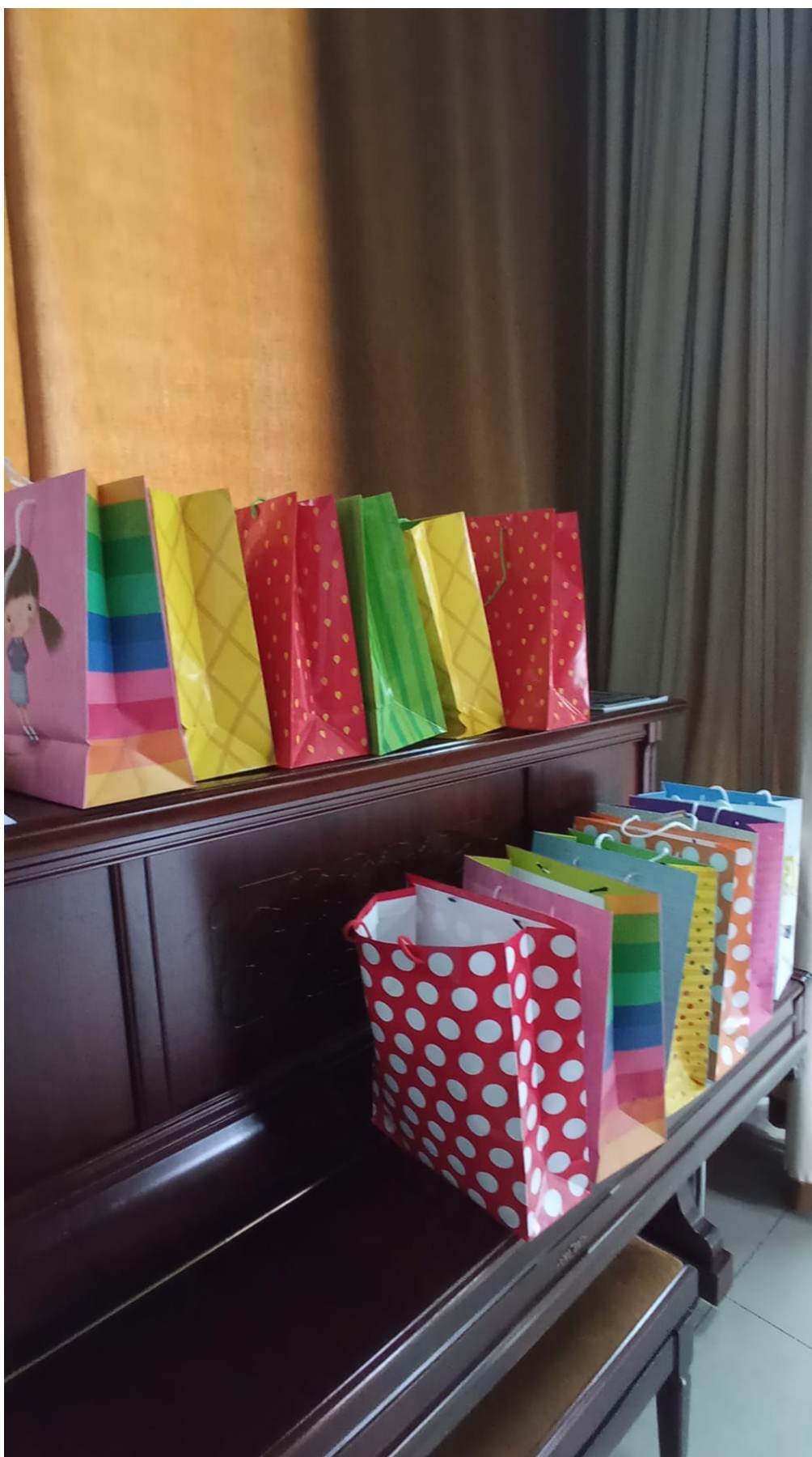
Prezenty na przywitanie dla dzieci z Ukrainy