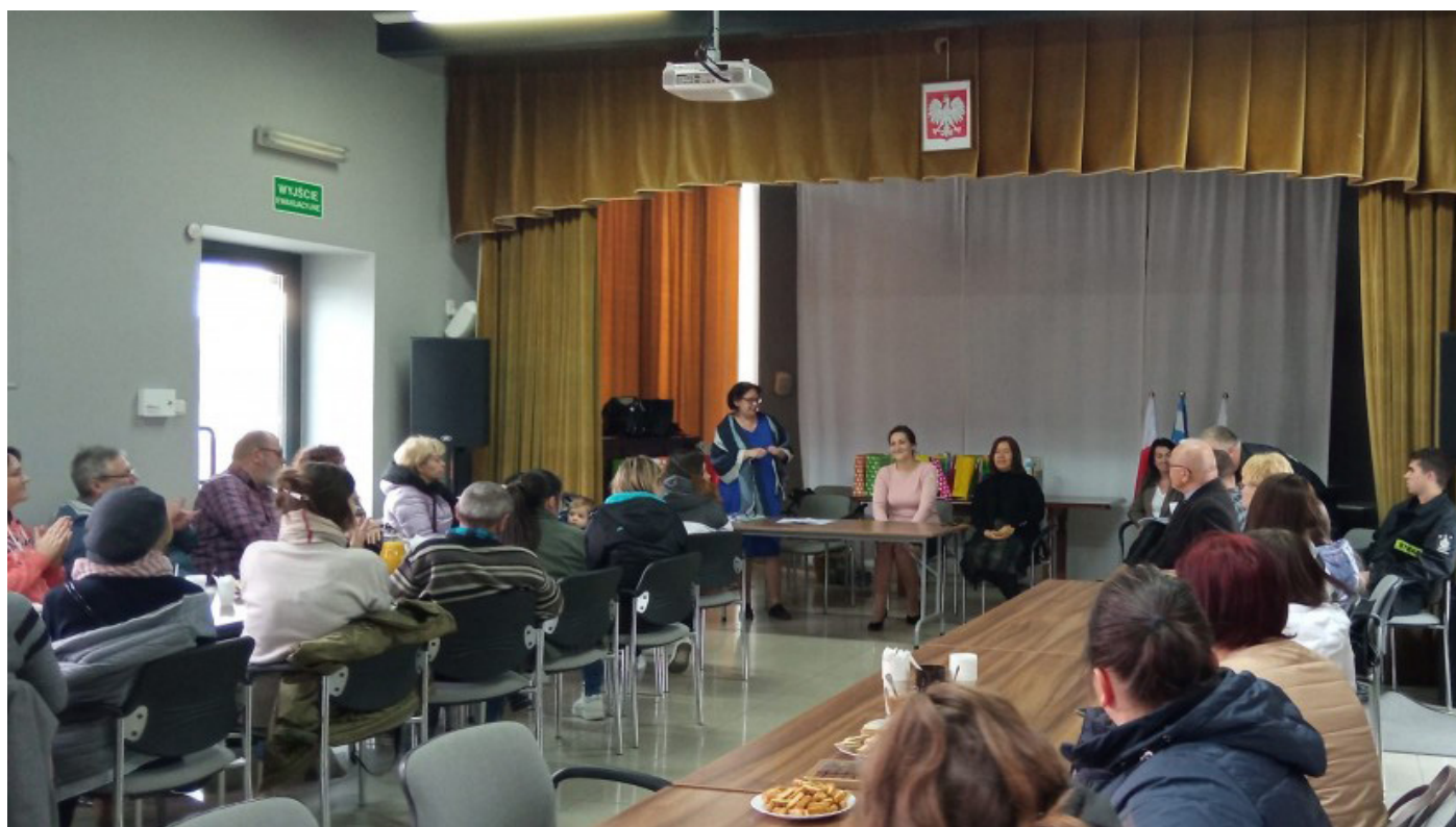
Spotkanie z uchodźcami