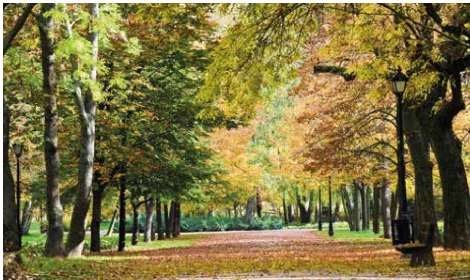
Po rewitalizacji wszystkie aleje otrzymały zwirową nawierzchnię.

o charakterze spacerowo-wypoczynkowym, zakładane na peryferiach miasta, przy głównych drogach wyjazdowych, w powiązaniu z doliną rzeczną, bez ściślejszego powiązania kompozycyjnego z układem urbanistycznym. Park zlokalizowano na wschód od miasta, na wschodnim brzegu rzeki Bzury. Do dziś składa się z dwóch części: z przełomu XVIII–XIX wieku i założonej po II wojnie światowej. W Parku były dwie piękne aleje: jedna nad rzeką wysadzana kasztanowcami (obecnie jest to aleja lipowa), druga grabowa zamykała park od południa (obecnie jest to aleja brzoza). Park tak bardzo tętnił życiem, że w pewnym okresie regularnie odbywały tam się