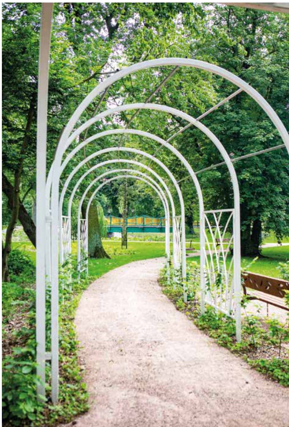
| Berso w parku miejskim w Rawie Mazowieckiej.