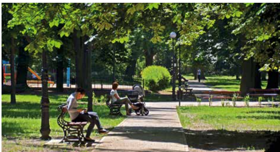
Park im. Władysława Stanisława Reymonta: alejka prowadząca do placu zabaw.

W 1948 r. park został przejęty przez Zarząd Miasta Łodzi i otrzymał imię, podobnie jak sąsiadujący z nim plac, Wł. St. Reymonta. W latach 1951–1952 dostosowano teren do użytku publicznego, tj. zlikwidowano ogrodzenie, utworzono aleje, zbudowano żelbetową barierę wzdłuż stawu (od ul. Piotrkowskiej), wybudowano plac zabaw, założono różankę oraz ustawiono dwie rzeźby ( Para koni – dziś już