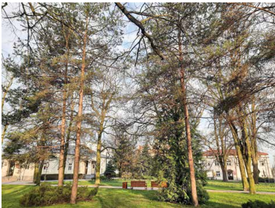
| Budynki urzędu miasta w cieniu parkowych drzew w Zduńskiej Woli.

Zduńska Wola jest gminą miejską położoną w województwie łódzkim na skrzyżowaniu szlaków komunikacyjnych, zarówno drogowych, jak i kolejowych. Miasto znajduje się 176 km na zachód od Warszawy, 50 km od Łodzi, 165 km na północny wschód od Wrocławia i około 200 km od Poznania. Obok miasta biegnie droga ekspresowa S8 oraz krzyżują się magistrale. Zaludnienie na dzień 30.06.2021 r. to 39 829 mieszkańców (stałych i czasowych). Miasto 239 zajmuje powierzchnię blisko 25 km 2 .