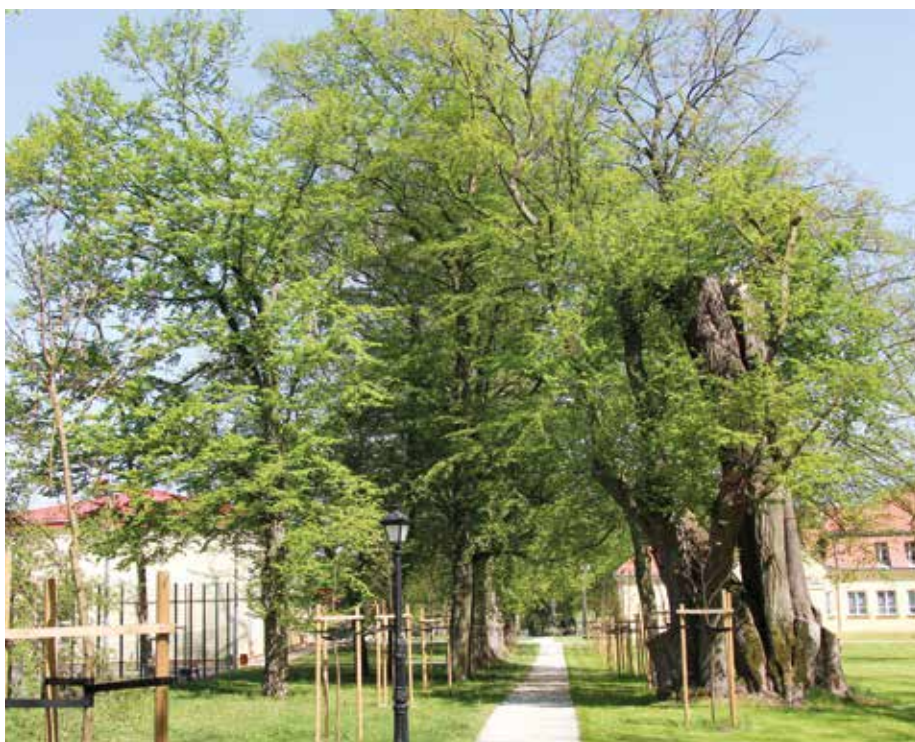
| Park w Parzniewicach Małych.