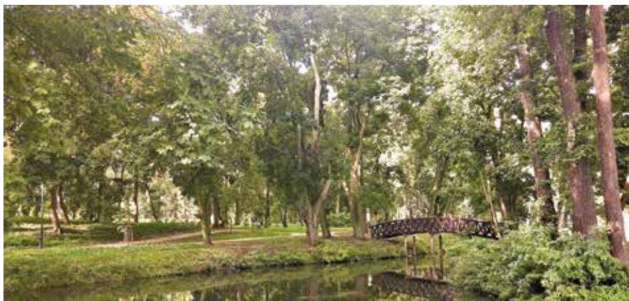
| Park w Moszczenicy: alejki i kładka dla pieszych.

Gmina Moszczenica jest gminą wiejską położoną w centralnej części województwa łódzkiego, w północnej części powiatu piotrkowskiego. Graniczy: od północy z Czarnocinem (powiat piotrkowski) i Będkowie (powiat tomaszowski); od wschodu z Wolborzem (powiat piotrkowski); od południa z Piotrkowem Trybunalskim (powiat m. Piotrków Trybunalski); od zachodu z Grabicą (powiat piotrkowski) i Tuszyń (powiat łódzki wschodni). Obszar gminy obejmuje 111,49 km 2 i zamieszkiwany jest przez 12 696 osób (stan na 30.06.2021 r.). 228