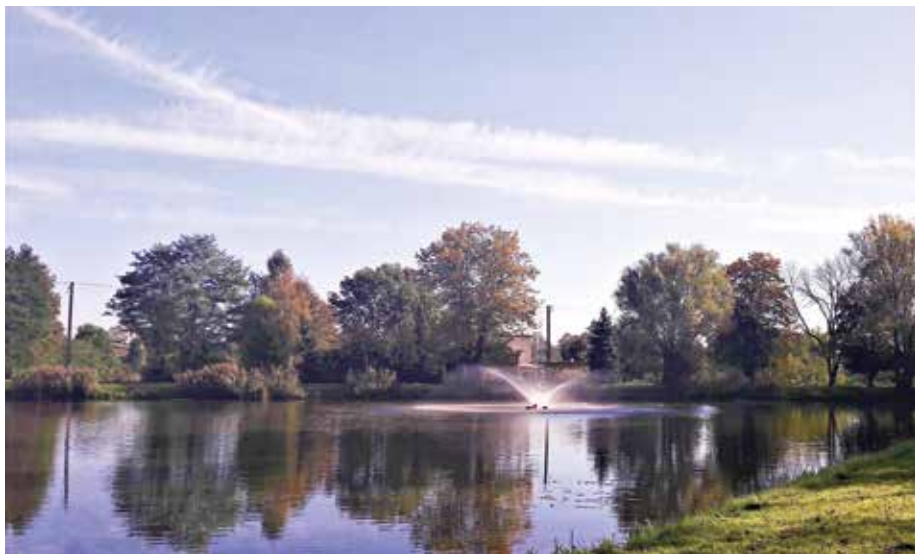
Park w Moszczenicy: fontanna.