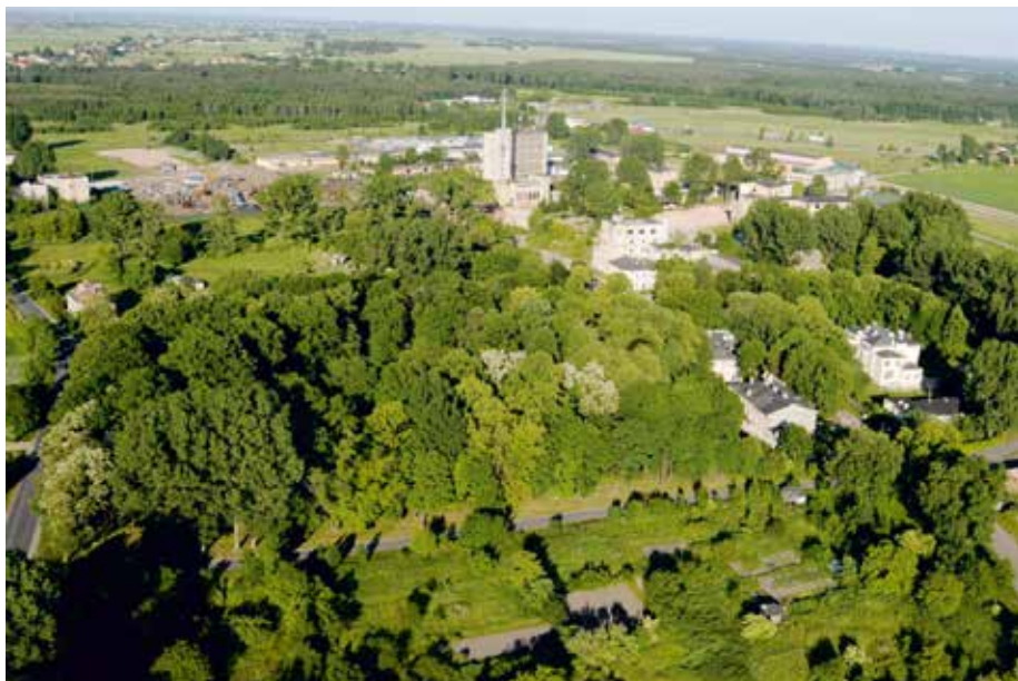
| Widok z lotu ptaka na park w Woli Krzysztoporskiej.

Zespół dworsko-parkowy posiada wysokie walory historyczne, artystyczne i przyrodnicze. Na terenie zespołu znajdują się obiekty objęte gminną ewidencją zabytków. Są to: willa z 1910 r. położona na działce nr 480/12, willa z 1915 r. położona na działce nr 480/60, dwór z połowy XIX w. położony na działce nr 480/12, budynek mieszkalny położony na działce nr 480/11 (wszystkie te obiekty są w posiadaniu osób prywatnych), park z pocz. XX w. oraz dwie rzeźby parkowe z początku XVIII w.