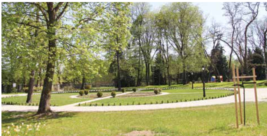
| Park w Parzniewicach Małych.

aleja. Według Odrysu pomiaru dóbr prywatnych Parzniewice z 1902 r. ogród łączący dwory to sad lub ogród użytkowy. Na tej mapie widać również, że w otoczeniu nowego dworu istniały budynki (w części wschodniej i zachodniej) – nie zachowane do czasu obecnego.