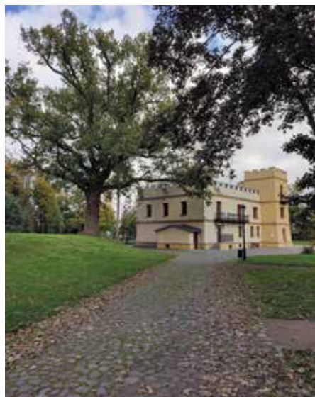
| Zameczek (siedziba Gminnego Ośrodka Kultury i Sportu w Łaniętach). Po lewej stronie dąb – jeden z pomników przyrody.

W obrębie parku rośnie około 500 drzew, głównie pochodzenia rodzimego, m.in. dęby, jesiony, lipy i graby. Spośród nich najcenniejszymi są drzewa, które zostały uznane za pomniki przyrody ze względu na szczególne walory przyrodnicze, w tym dąb szypułkowy o obwodzie pnia 376 cm, znajdujący się przy Gminnym Ośrodku Kultury i Sportu.