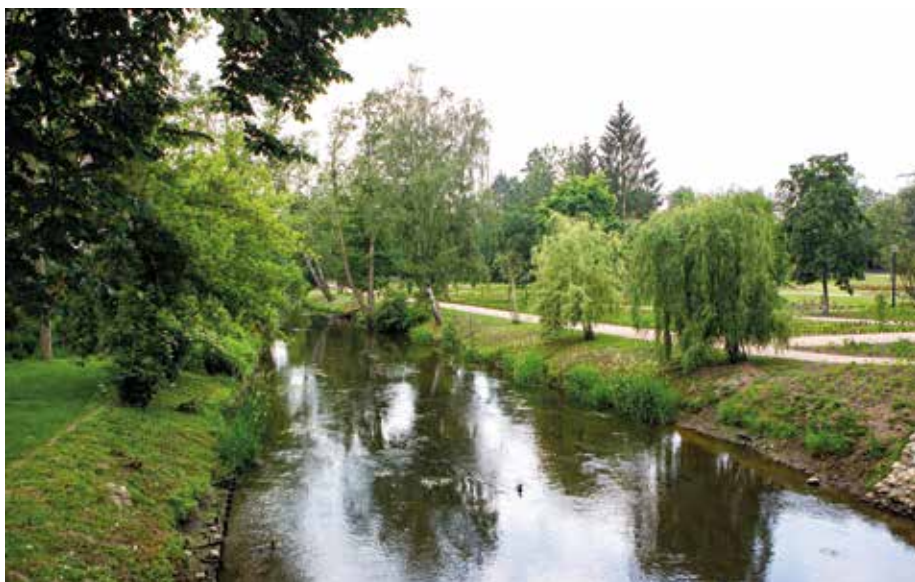
| Rzeka Rawka – rezerwat.

Projekt przeprowadzonej w latach 2017–2018 rewitalizacji parku,