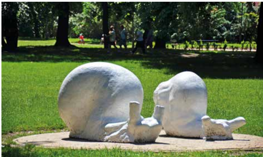
Park im. Władysława Stanisława Reymonta: rzeźba Dwa ślimaki.

W 1948 r. park został przejęty przez Zarząd Miasta Łodzi i otrzymał imię, podobnie jak sąsiadujący z nim plac, Wł. St. Reymonta. W latach 1951–1952 dostosowano teren do użytku publicznego, tj. zlikwidowano ogrodzenie, utworzono aleje, zbudowano żelbetową barierę wzdłuż stawu (od ul. Piotrkowskiej), wybudowano plac zabaw, założono różankę oraz ustawiono dwie rzeźby ( Para koni – dziś już