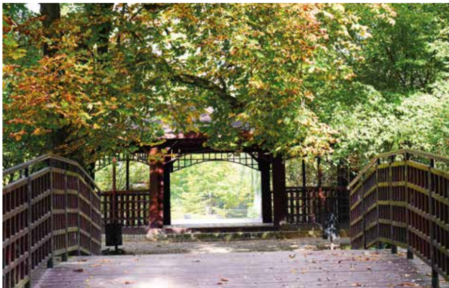
Wysepka z drewnianą altaną na środku.

wymieniono całą stalową konstrukcję, przy drugim wymieniono drewnianą podłogę i barierki, a przy trzecim – same barierki. Dzięki tym zabiegom mostki nabrały jednolitego kształtu i skomponowały się z estetyką altany. Ważnym elementem rewaloryzacji Parku Miejskiego było utworzenie ścieżki edukacyjnej – pieszego szlaku wzdłuż alei parkowych. Ścieżka wyposażona jest w 12 tablic opisujących najcenniejsze okazy roślin występujących w parku, a jej przebieg wyznaczają opisywane gatunki roślin. Elementem wpływającym na propagowanie kultury fizycznej