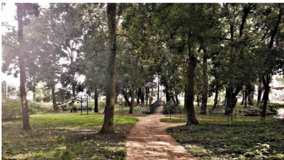
Park w Moszczenicy: kładka dla pieszych.