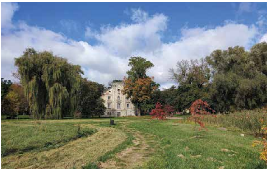
| Pałac wpisany do rejestru zabytków na terenie zabytkowego parku w Łaniętach.

parkowych w połączeniu z otaczającym krajobrazem.