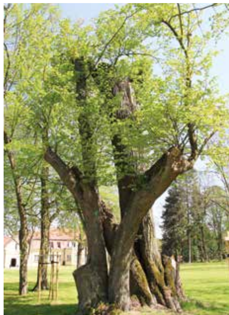
| Park w Parzniewicach Małych.

Park w Woli Krzysztoporskiej został wpisany do gminnej ewidencji zabytków. Obecnie toczy się postępowanie w sprawie wpisu do rejestru zabytków. W sąsiedztwie parku znajduje się dwór, który znajduje się w rejestrze nr 275 z 30.11.1978 r.