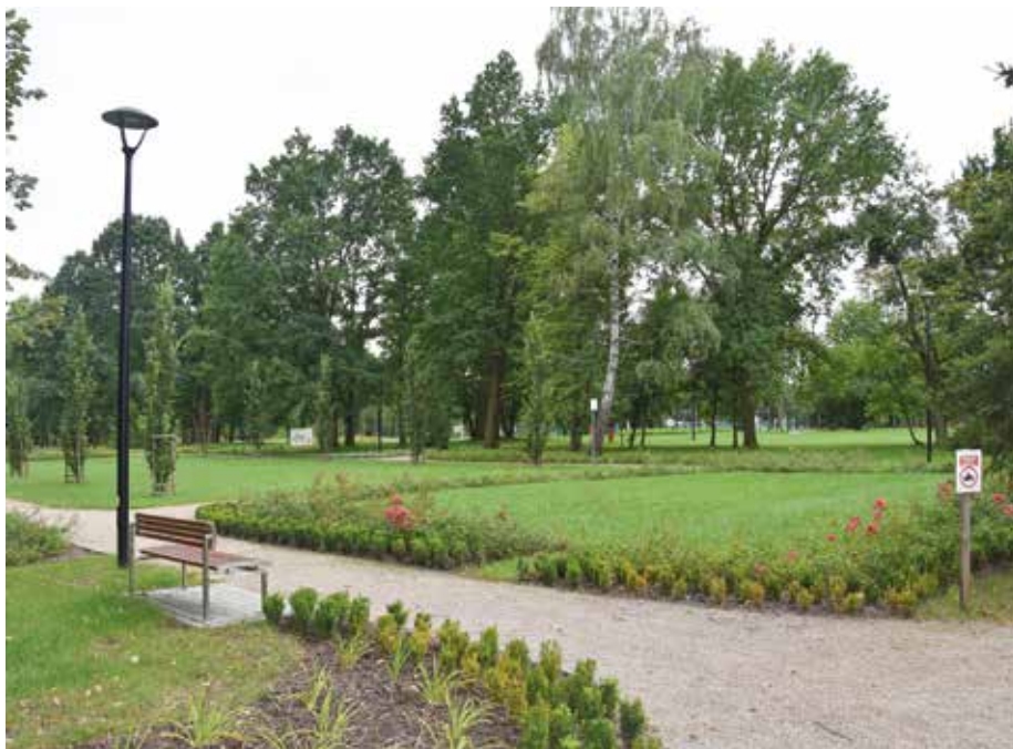
| Park w Dzierżąznej.