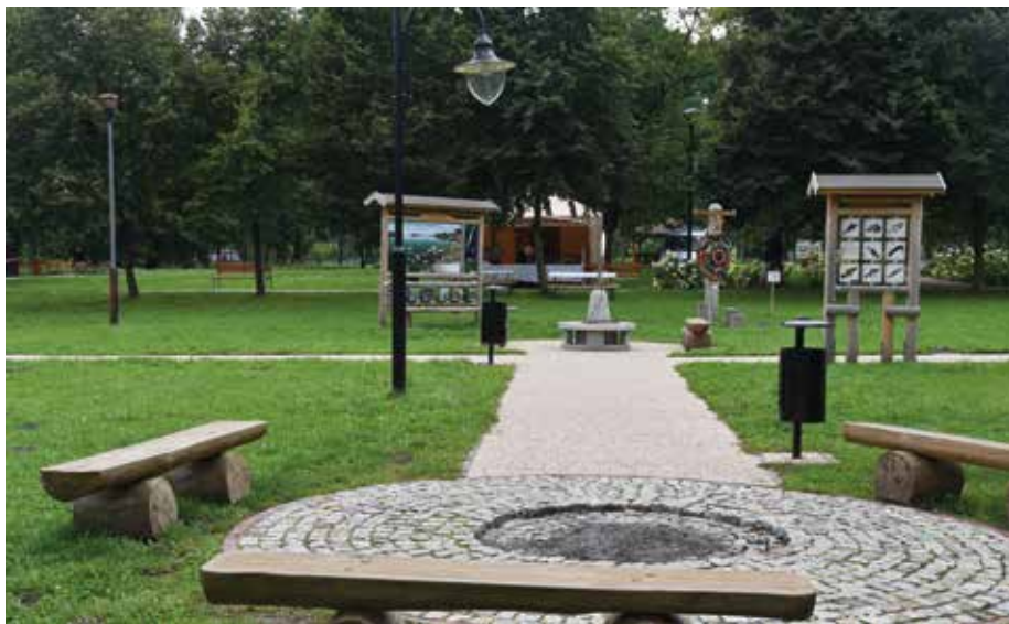
| Park w Dzierżącej.

sprzedany Izbie Rzemieślniczej w Warszawie i zaadaptowany na ośrodek kolonijny. Teren w kolejnych latach ma kilku właścicieli. Od 1976 r. jego użytkownikiem były Zakłady Przemysłu Bawełnianego im. Obrońców Pokoju „UNIONTEX”. W 1984 r. teren Zakładowego Ośrodka Wczasowego wyposażono w instalacje: elektryczną, wodociągową i ściekową. Pobudowano drogi, place, parkingi, boiska i ciągi pieszce oraz wybudowano 20 domków kempingowych. W 1984 r. wichura uszkodziła szereg wartościowych drzew. W 1989 r. nastąpiła w Polsce zmiana systemu polityczno-gospodarczego, która spowodowała przekazanie (jako część majątku przedsiębiorstwa)