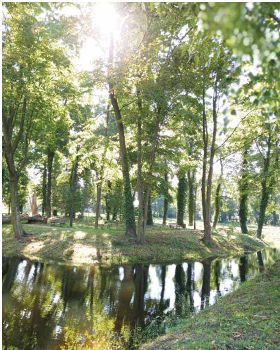
| Widok na park w Starym Gostkowie.

do pałacu w kierunku wschodnim oś przebiega przez okrągły gazon, następnie wzdłuż podjazdu obsadzonego obustronnie żywopłotami z buka i bukszpanu do głównej bramy wjazdowej. Przedłużenie osi stanowi