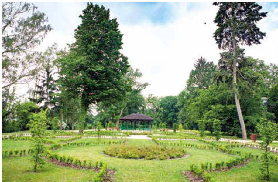
| Altana w parku miejskim w Rawie Mazowieckiej.

jakie miasto przeszło na początku XIX w. Od 1978 r. figuruje w rejestrze zabytków województwa łódzkiego (nr A/478). Pod względem przestrzennym, należy do najstarszej, historycznej