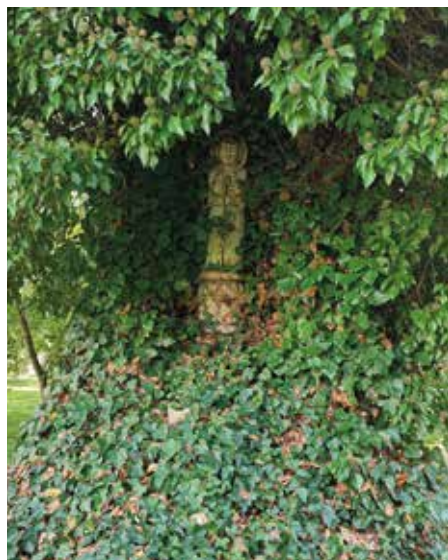
Kapliczka w drzewie na terenie parku zabytkowego w Łaniętach.

Gmina Łanięta jest gminą wiejską położoną w północnej części województwa łódzkiego, w powiecie kutnowskim. Gmina, która zajmuje powierzchnię ok. 55 km, usytuowana jest na styku trzech województw: łódzkiego, kujawsko-pomorskiego (od północnego zachodu) i mazowieckiego (od północnego wschodu). Według danych z dnia 30 czerwca 2021 r. gminę zamieszkiwały 2 292 osoby. 223