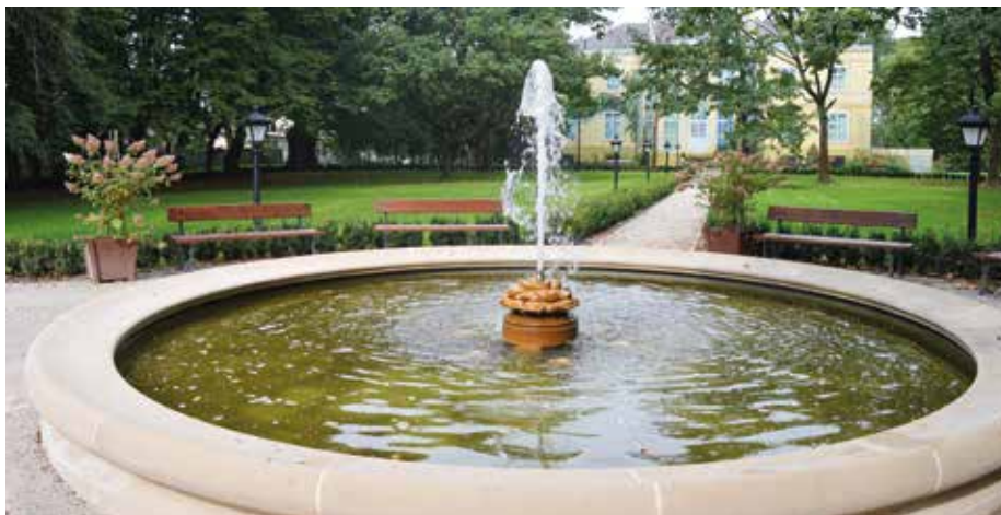
Park podworski w Zadzimiu: fontanna z widokiem na pałac.