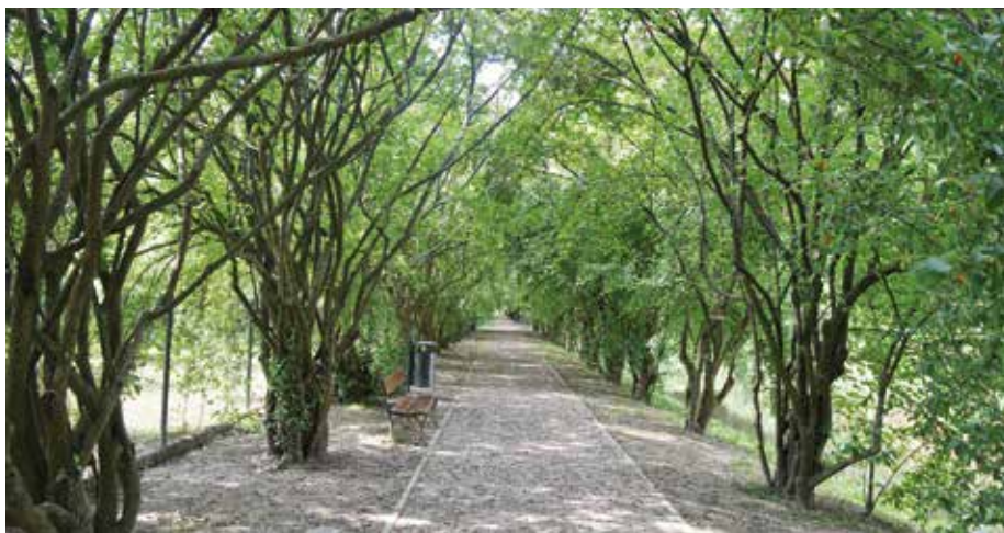
Park podworski w Zadzimiu: zabytkowa aleja dereniowa.

Rada Gminy w nawiązaniu do znajdującej się w parku ponad 100-letniej, wyjątkowej w skali kraju alei dereniowej, nadała mu imię „Dereniowy Skarb”. Symbolem parku została gałązka z owocem derenia. Przeprowadzona rewaloryzacja spowodowała, że to szczególne miejsce nie tylko odzyskało swój dawny blask, lecz także stworzyło możliwość szerszego wykorzystania parku dla potrzeb kulturalnych i społecznych mieszkańców gminy oraz turystów.