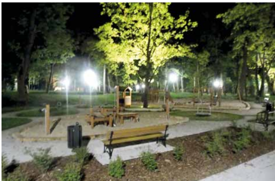
| Park w Woli Krzysztoperskiej nocą.

Gmina Wola Krzysztoperska położona jest w zachodniej części powiatu piotrkowskiego. Jest jedną z największych obszarowo gmin województwa łódzkiego – zajmuje powierzchnię 17 041 ha i liczy blisko 11 600 mieszkańców. Na jej terenie krzyżują się trzy ważne szlaki komunikacyjne: droga krajowa A-1 (Warszawa – Katowice), droga krajowa nr 8 (Piotrków Trybunalski – Wrocław) oraz linia kolejowa łącząca Piotrków Trybunalski z Bełchatowem (Rogowiec). 234