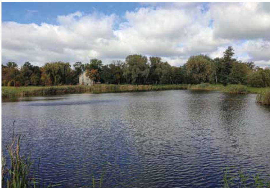
| Staw na terenie parku zabytkowego w Łaniętach.

W obrębie parku rośnie około 500 drzew, głównie pochodzenia rodzimego, m.in. dęby, jesiony, lipy i graby. Spośród nich najcenniejszymi są drzewa, które zostały uznane za pomniki przyrody ze względu na szczególne walory przyrodnicze, w tym dąb szypułkowy o obwodzie pnia 376 cm, znajdujący się przy Gminnym Ośrodku Kultury i Sportu.