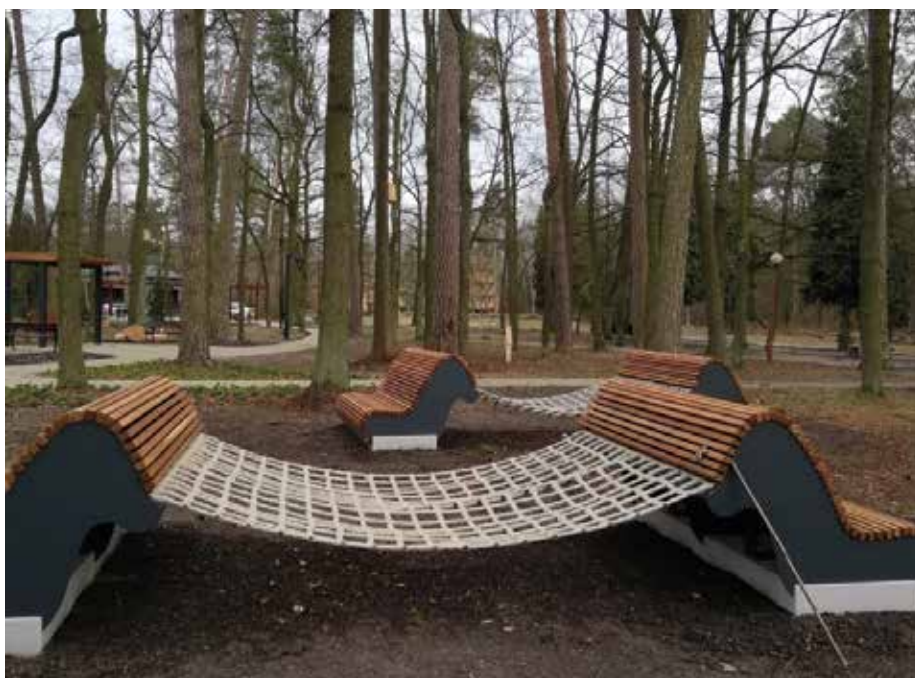
| Park w Spale. (miejsce do odpoczynku)

mln zł to dotacja, a reszta to pożyczka z Wojewódzkiego Funduszu Ochrony Środowiska. Prace objęły teren wokół fontanny, a także przeniosły się na drugą stronę Al. Piłsudskiego, za Hotel Mościcki. W parku pojawiły się nasadzenia, oświetlenie, monitoring, stanęły nowe ławeczki, śmietniki oraz wiele ciekawych elementów małej architektury: drewniane zabawki, huśtawki czy domki dla owadów. Przywrócono klimat, jaki tu panował za czasów prezydenta Ignacego Mościckiego. W przyszłości zaplanowano rewitalizację terenu wokół posągu żubra.