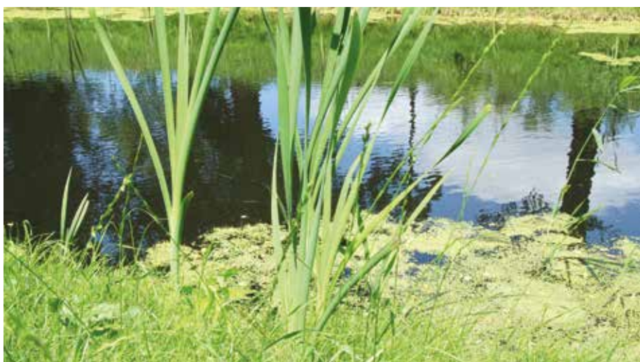
| Park w Woli Krzysztoporskiej.