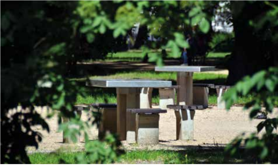
| Park im. Władysława Stanisława Reymonta: zestawy stolików szachowych.

nieistniejąca, i Dwa ślimaki ). W latach 90. XX w. umocniono brzegi stawu, zbudowano studnię głębinową zapewniającą dopływ wody do stawu, a w 2004 r. (w ramach programu Fontanny dla Łodzi ) na stawie zainstalowano fontannę w kształcie kwiatu lilii, zaprojektowaną przez łódzką rzeźbiarkę Zofię Władysławę Łuczak.