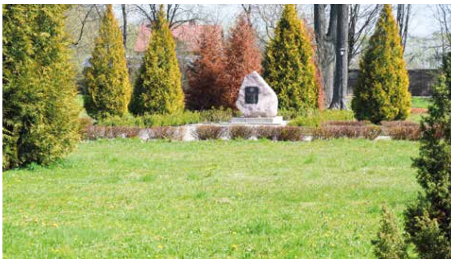
| W centralnym punkcie Parku: kamień upamiętniający 50-lecie Złotu Harcerzy Ziemi Łódzkiej oraz obchody 100-lecia Harcerstwa Polskiego.

dostatecznych warunków tlenowych w cieklu zastosowano dwa gejzery, które pozwalają na wymuszenie cyrkulacji i napowietrzenie wody. Prace dotyczyły zmodernizowania infrastruktury komunikacyjnej, w tym wykonaniu nowej alei wzdłuż cieklu wodnego po jego północnej stronie, z ławkami i śmietnikami. Modernizacji poddano także altanę umiejscowioną w centralnej części wyspy. Wymieniono pokrycie dachowe, wykonano podłogę z drewna iglastego, a całość konstrukcji altany została wyczyszczona i pomalowana. Wokół altany wykonano cokół z kostki granitowej oraz schody przy wejściu i wyjściu z altany. Wyremontowano również trzy drewniane mostki. Przy pierwszym