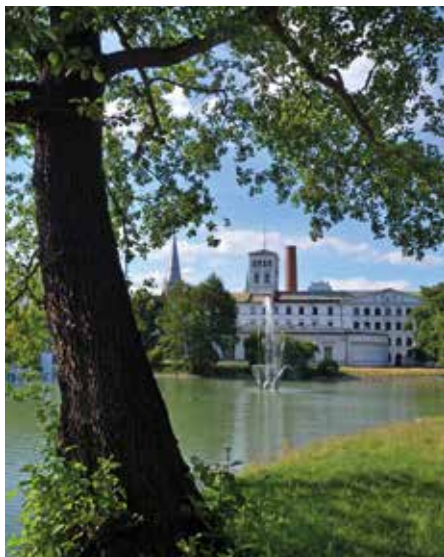
Centralne Muzeum Włókiennictwa: widok na fontannę i Białą Fabrykę.

włókiennicze. Osiadł w Łodzi i tu zaczął tworzyć swoje przemysłowe imperium przy ul. Piotrkowskiej. Obecny park był prywatnym ogrodem rodziny Geyerów, założonym ok. połowy XIX w. przez nieznanego projektanta. Teren był otoczony drewnianym, wysokim ażurowym ogrodzeniem, bielonym raz w roku. Ogród posiadał wielki staw (na rzece Jasień) z wyspą, która była punktem widokowym na zabudowania fabryczne, w części spacerowej zlokalizowano romantyczne aleje w stylu angielskim oraz kwietniki. Po II wojnie światowej fabrykę oraz należący do niej park upaństwowiono i utworzono Państwowe Zakłady Przemysłu Bawełnianego nr 3.