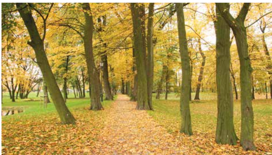
| Park w Woli Krzysztoporskiej.

Park w Woli Krzysztoporskiej w obecnym kształcie i granicach związany jest z dobrami rodu Krzysztoporskich oraz majątkiem rodziny Szpilfoglów, których działania miały duży wpływ na wygląd obiektu, bo jego układ przestrzenny i funkcje zmieniały się w zależności od potrzeb użytkowników. Kompozycja parku wynikała