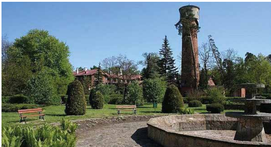
| Zabytkowy Park w Spale.

architekta. Obok powstały koszary dla sotni kozackiej i kompanii jegrów, kasyno oficerskie, domy dla gości. Wieżę ciśnień postawiono w 1890 r. Około 1900 r. zbudowano jeszcze dwa hotele dla carskich gości (mieszczą się tam obecnie Dom Wczasowy Savoy i apartamenty „Dzik”). Pod koniec XIX wieku wokół pałacu urządzono park w stylu krajobrazowym według