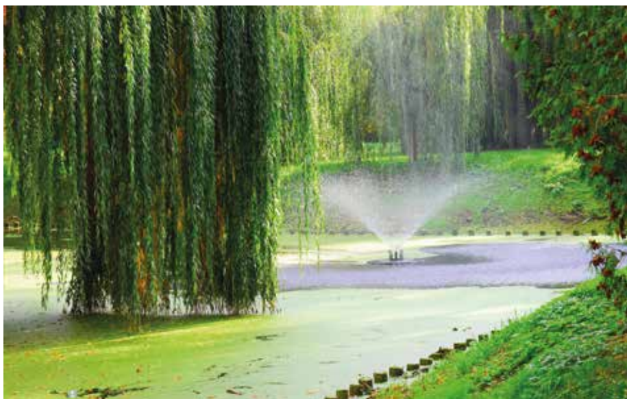
| Ciek wodny fosy wyposażony w dwa gejszery utrzymujące dostateczne warunki tlenowe.

Królewskie Miasto, które w roku 1999 powróciło do statusu stolicy powiatu i najważniejszego ośrodka w regionie łęczyckim. Położone jest 38 km na północ od Łodzi nad rzeką Bzurą, na skrzyżowaniu drogi krajowej 91 z krajową 60 i drogą wojewódzką 703. Zwarty zespół zabudowy miejskiej dostosowany do miejscowych warunków fizjograficznych zajmuje powierzchnię 8,9 km 2 . Miasto liczy obecnie 13 613 mieszkańców. 225