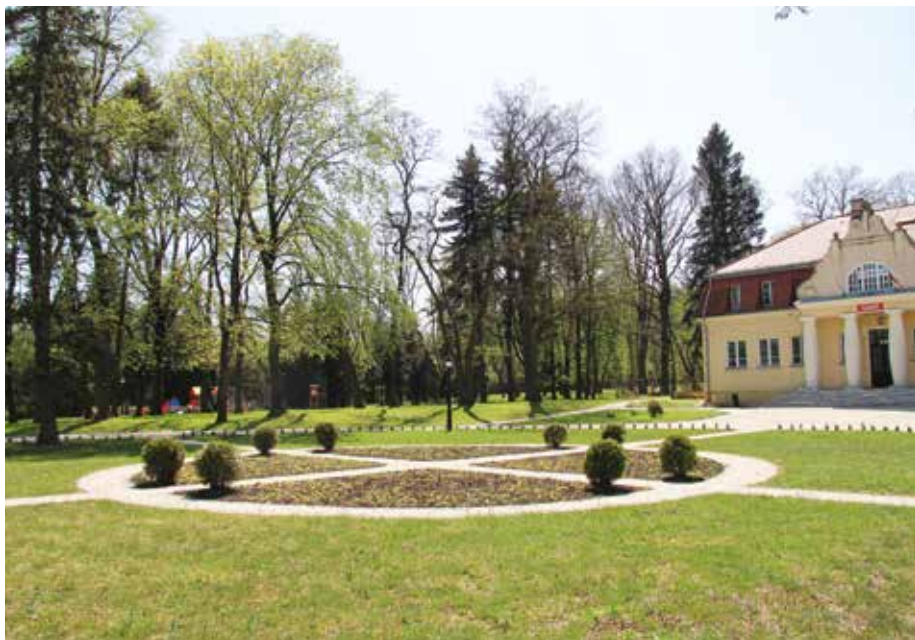
| Park w Parzniewicach Małych.