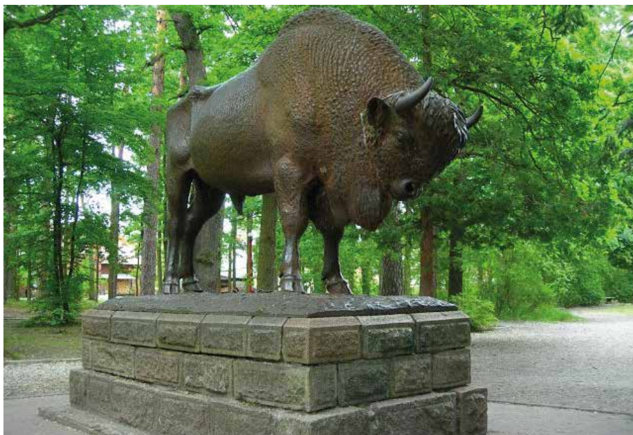
| Posąg Żubra.

architekta. Obok powstały koszary dla sotni kozackiej i kompanii jegrów, kasyno oficerskie, domy dla gości. Wieżę ciśnień postawiono w 1890 r. Około 1900 r. zbudowano jeszcze dwa hotele dla carskich gości (mieszczą się tam obecnie Dom Wczasowy Savoy i apartamenty „Dzik”). Pod koniec XIX wieku wokół pałacu urządzono park w stylu krajobrazowym według