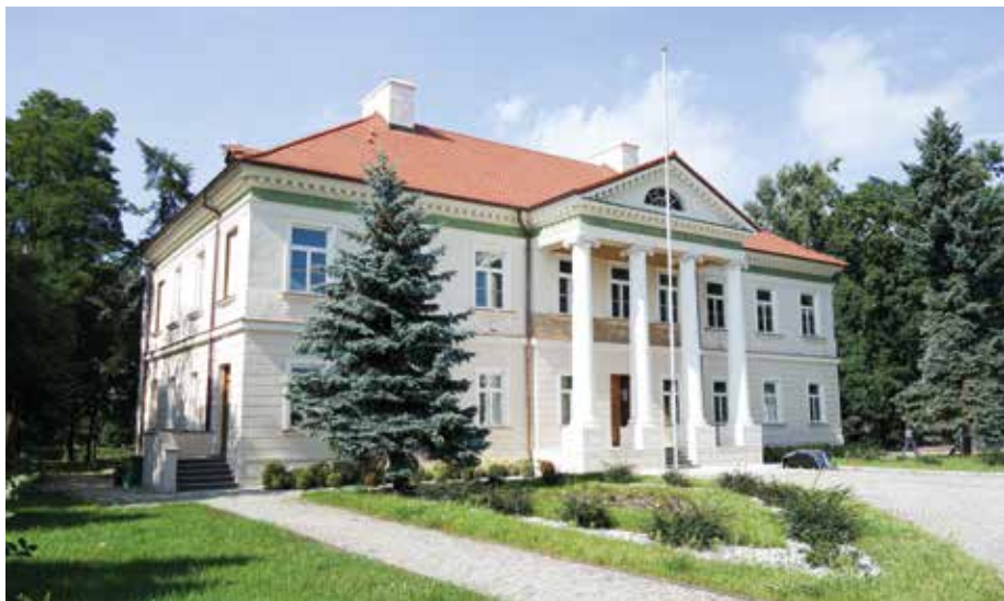
| Pałac w Starym Gostkowie.