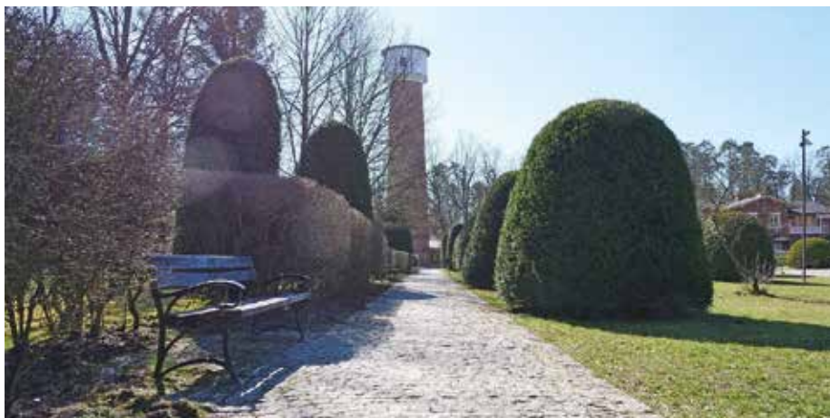
| Zabytkowy Park w Spale. (widok na wieżę ciśnień)

Gmina Inowłódz jest gminą wiejską w województwie łódzkim, w powiecie tomaszowskim. Położona po obu stronach rzeki Pilicy i należy do najciekawszych obszarów województwa łódzkiego. Liczba ludności na dzień 30.06.2021 r. wynosiła 3 940 mieszkańców. 221 Powierzchnia gminy – 98 km 2 .