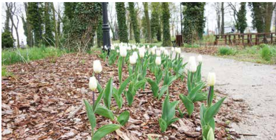
| Tulipany na wyspie w Parku w Starym Gostkowie.

frontowej oraz półkolistym ryzalitem od strony ogrodu. W skład zespołu pałacowo-parkowego wchodzi dwie klasycystyczne parterowe oficyny – pomiędzy nimi a pałacem znajduje się dziedziniec wjazdowy. Granice założenia parkowego wyznaczają