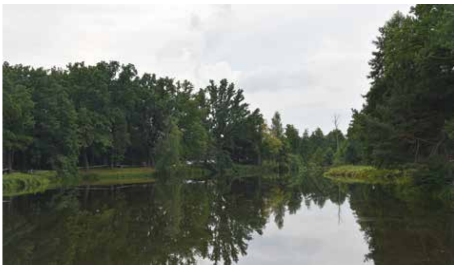
| Park w Dzierżącej.