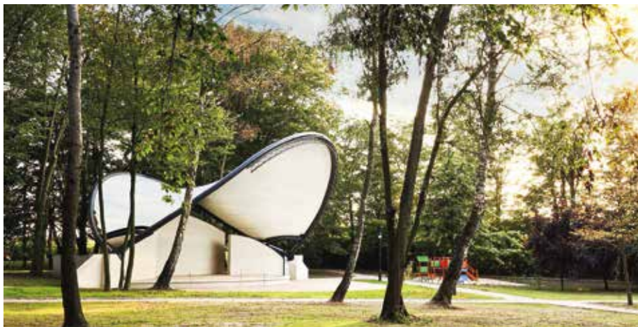
Park podworski w Zadzimiu: parkowy amfiteatr.

Uchwałą Rady Gminy Zadzim z 10 listopada 2005 r. został uznany za zespół przyrodniczo-krajobrazowy. Jest to forma ochrony, którą obejmuje się fragmenty krajobrazu naturalnego i kulturowego, zasługujące na ochronę ze względu na ich walory widokowe i estetyczne. Na terenie parku znajduje się również kilka cennych drzew oraz aleja jednogatunkowa drzew uznanych za pomniki przyrody. Poza ochroną konserwatorską, wynikającą z przepisów prawa i docenianą wartość kulturową obiektu, dostrzeżono potrzebę ochrony jego wartości przyrodniczych.