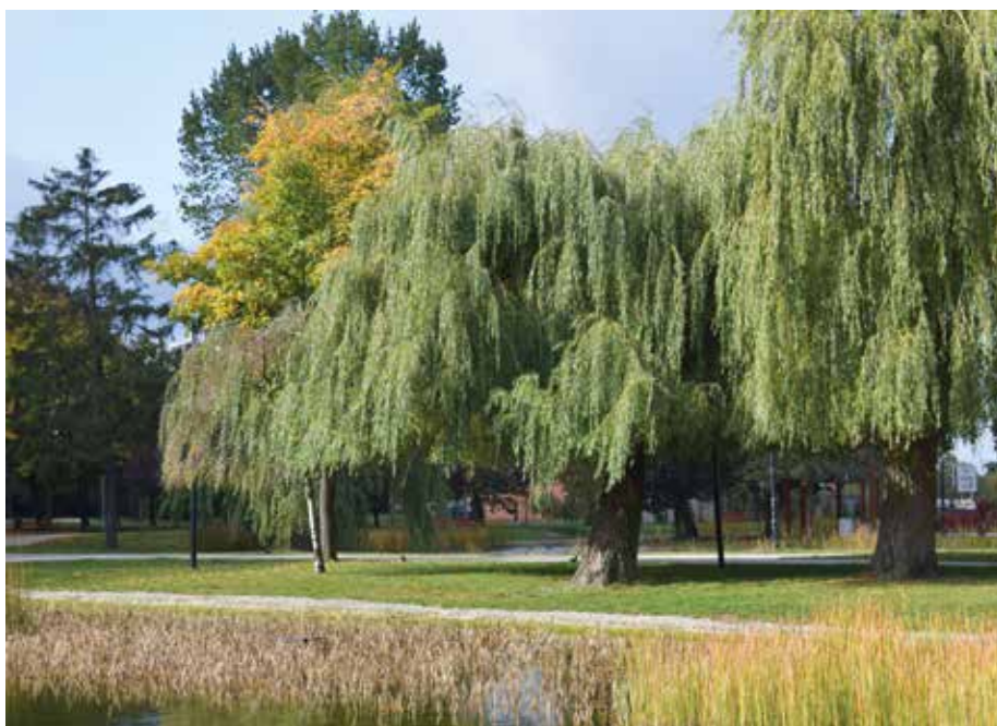
| Wierzby nad małym stawem w parku w Zduńskiej Woli.

układu ekologicznego Zduńskiej Woli (korytarz ekologiczny i lokalne biocentra). Zbiorniki wodne na terenie parku wymagały kompleksowej renowacji, a nie tylko odmulenia. Zasilane są wodami z rzeki za pomocą systemu urządzeń piętrząco-upustowych, których stan techniczny był niezadawalający. Skorodowany beton na skarpach, zamulone wloty przepustów oraz braki elementów urządzeń piętrzących uniemożliwiały prawidłowe funkcjonowanie zbiorników, wykorzystywanych jako powierzchnia buforowa nadmiaru wody z rzeki.