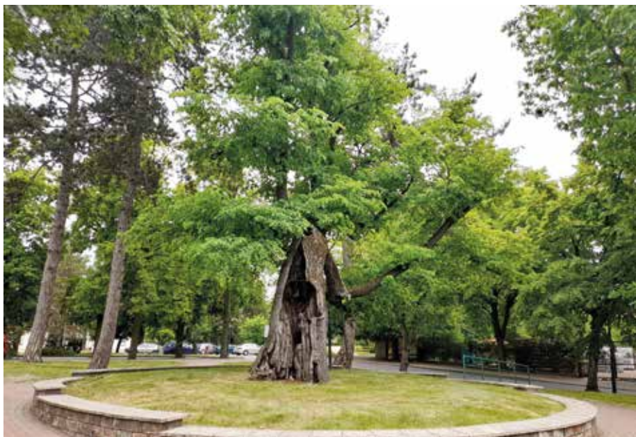
| Zabytkowy wąż w parku w Zduńskiej Woli.

Park dysponował również stajnią dla koni i zaprzęgów. Odwiedzający go zduńskowolanie mogli obserwować szlachetne łabędzie pływające po stawie na tle fontanny lub zwiedzić niewielkie zoo z egzotycznymi zwierzętami. Mogli również zażyć kąpieli lub wypożyczyć łódkę zacumowaną w przystani. Zimą staw zamieniał się w ślizgawkę dla łyżwiarzy. Na wyspie ustawiono altanę oraz wybudowano muszlę koncertową. W 1929 r.