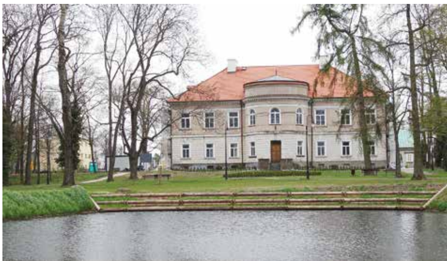
| Pałac w Starym Gostkowie od strony zachodniej.

Gmina Wartkowice jest gminą wiejską w powiecie poddębickim. Graniczy z 6 innymi gminami: Uniejów, Poddębice i Dalików (powiat poddębicki); Świnice Warckie i Łęczyca (powiat łęczycki) oraz Parzęczew (powiat zgierski). Liczba ludności 232 na dzień 30.06.2021 r. wynosiła 6 255 osób. Powierzchnia gminy – 141,80 km 2 .