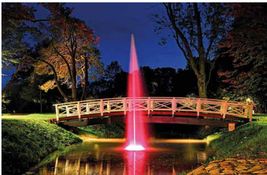
| Park podworski w Zadzimiu: fontanna pływająca, nocą.

Gmina Zadzim jest gminą wiejską położoną w południowo-wschodniej części powiatu poddębickiego, w zachodniej części województwa łódzkiego. Obszar gminy wynosi 144,4 km 2 . Liczba ludności w gminie na dzień 30.06.2021 wynosiła 4 895 mieszkańców. Podstawą gospodarki jest rolnictwo. Na powierzchni 11 628 ha uprawia się przede wszystkim wczesne ziemniaki i zboża. Zadzim i okoliczne miejscowości to także zagłębie sadownicze zaopatrujące okoliczne gminy i aglomerację łódzką w wysokiej klasy owoce, a szczególnie w cenione odmiany jabłek. 237