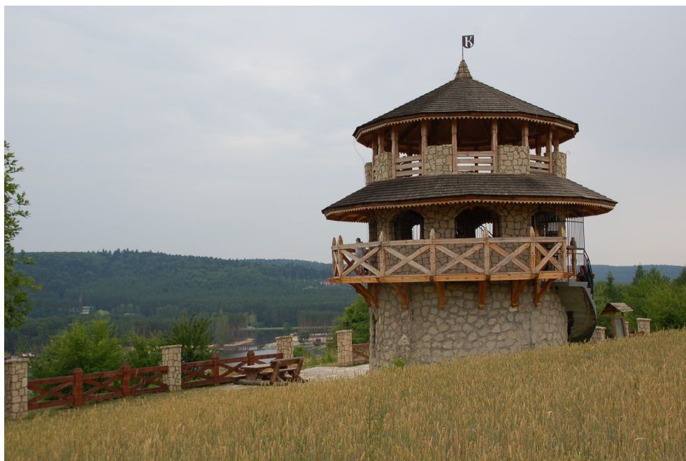
Baszta widokowa w Krasnobrodzie