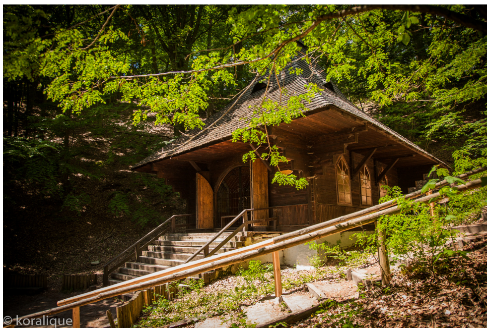
Kapica św. Rocha w Krasnobrodzie