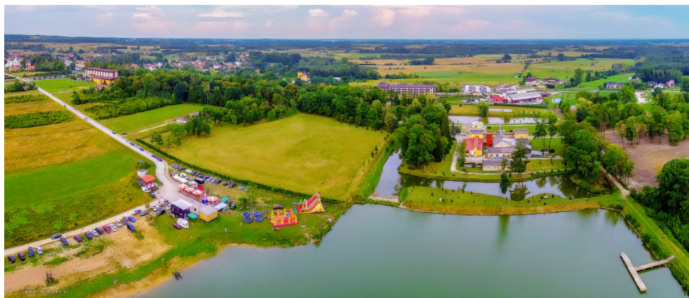
Solec-Zdrój widziany z lotu ptaka