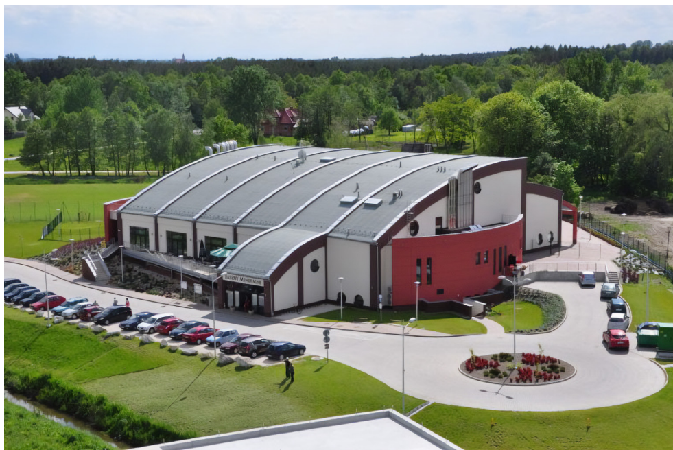
Kompleks Basenów Mineralnych w Solcu-Zdroju